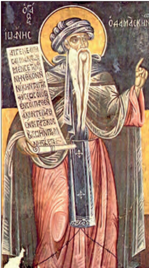
Ἅγιος Ἰωάννης ὁ Δαμασκηνός. Μιχαὴλ Αναγνώστου, 1734. Βυζαντινὸ Μουσεῖο Χίου.

(Κυριακή της Ορθοδοξίας, Στιχηρό τροπάριο του Εσπερινού)