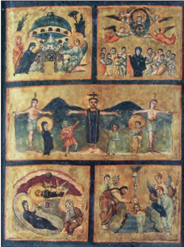
Σκηνές από τη ζωή του Χριστού, 6ος αι. Μουσείο Βατικανού.