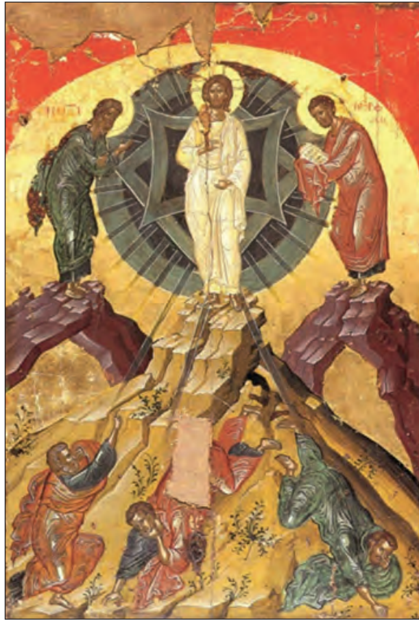
Μεταμόρφωση του Σωτήρος Χριστού, Θεοφάνους του Κρητός, Ι.Μ. Σταυρονικήτα, 1546 μ.Χ.

Η υπεράσπιση των ησυχαστών μοναχών άρχισε με το συγγραφικό έργο του Γρηγορίου Παλαμά και συνεχίστηκε με τις αντιρρητικές συγγραφές και των υπόλοιπων ομοφρόνων του, όπως του Φιλοθέου Κόκκινου και του Δαβίδ Δισύπατου. Όμως, η τελική νίκη των ησυχαστών πραγματοποιήθηκε μόνο μετά τις Συνόδους, στις οποίες καταδικάστηκαν οι αντιησυχαστικές αντιλήψεις και οι εκφραστές τους. Η πρώτη έλαβε χώρα το 1341, η δεύτερη το 1347 και μια τρίτη το 1351. Στην τελευταία αναγνωρίστηκε επισήμως η διδασκαλία περί Ησυχασμού ως αυθεντική διδασκαλία της Ορθόδοξης Εκκλησίας. Ο πατριάρχης Φιλόθεος Κόκκινος, ο Ιωσήφ Καλόθετος, ο Δαβίδ Δισύπατος και πολλοί άλλοι, αγωνίστηκαν να διακηρύξουν και να υποστηρίξουν, με τα αντιρρητικά έργα τους, την αρχαία δογματική παράδοση της Εκκλησίας περί της διάκρισης ουσίας και ενεργείας στον Θεό. Κατά την πατριαρχία του Φιλοθέου, αναγνωρίστηκε συνοδικώς η αγιότητα του Γρηγορίου του Παλαμά.