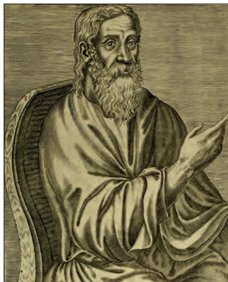
Κλήμης ὁ Ἀλεξανδρεὺς. Ἀπεικόνιση σε γαλλικὸ βιβλίο, André Thevet, 16ος αἰ.

Ο Κλήμης ὁ Ἀλεξανδρεὺς θεωρεῖται ὁ πρῶτος χριστιανὸς ἀνθρωπιστῆς. Εἶναι ὁ πρῶτος που προσπαθεῖ νὰ ἐπιτύχει τὴν ἐναρμόνιση καὶ τὸν συνδυασμὸ τῆς χριστιανικῆς πίστεως καὶ θεολογικῆς διδασκαλίας με τὴ φιλοσοφικὴ σκέψη. Εἶναι οὐσιαστικὰ θεωρητικὸς θεολόγος που, προκειμένου νὰ ἐρευνήσει καὶ νὰ διατυπώσει τὶς ἀρχές καὶ ἀλήθειες τῆς πίστεως, κάνει εὐρεία χρῆση τῆς μεθόδου τῆς ἀπολογίας καὶ τοῦ περιεχομένου τῆς φιλοσοφικῆς σκέψης καὶ γνώσης. Φρονεῖ ὅτι ἡ γνώση καὶ ἡ