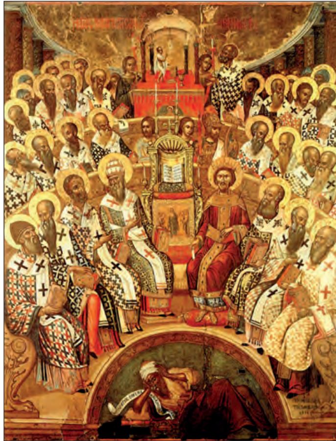
Η Α΄ Οικουμενική Σύνοδος, Μιχαήλ Δαμασκηνός, 1591. Αγία Αικατερίνη Σιναϊτών, Ηράκλειο.

Η συμβολή του Μ. Βασιλείου στην ερμηνεία και τη διατύπωση του Τριαδικού δόγματος υπήρξε εξίσου σημαντική και καθοριστική. Εισάγει στην Τριαδολογική του ορολογία και διδασκαλία τη σαφή διάκριση του «ακτίστου» και του «κτιστού»· «άκτιστος» είναι μόνο ο Τριαδικός Θεός· όλα τα άλλα όντα είναι «κτιστά». Για να αποφευχθεί ενδεχόμενη εννοιολογική ταύτιση των όρων «ουσία» και «υπόσταση» προβαίνει σε σαφή και αναγκαία θεολογική εννοιολογική διάκριση και διαφοροποίηση των όρων αυτών· ο όρος «ουσία» δηλώνει το «κοινόν» των «υποστάσεων» και ο όρος «υπόσταση» δηλώνει το «ίδιον», δηλαδή το «ιδιαιτερον», την ιδιαίτερη υπόσταση που διακρίνεται από τις άλλες υποστάσεις. Ο μεγάλος αυτός Πατήρ και Οικουμενικός Διδάσκαλος της Εκκλησίας αποσαφηνίζει θεολογικά και αποτυπώνει με πληρότητα τη δογματική έννοια του όρου «ομοούσιος»· ο όρος «ομοούσιος» ερμηνεύεται από τον Μ. Βασίλειο με την έννοια της ενότητας και