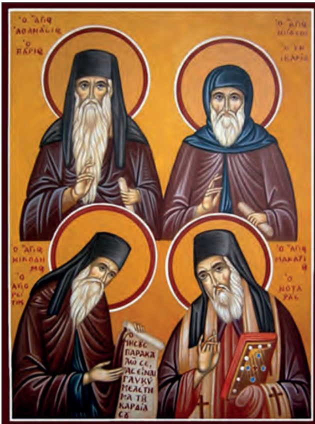
Οι Κολλυβάδες Άγιοι Πατέρες, 18ος αι.

ληγικά κειμένων των Πατέρων της Εκκλησίας. Ο Αθανάσιος Πάριος, επίσης, με τα έργα του και τον πύρινο λόγο του αντιμετώπισε την εκκοσμίκευση της εποχής του, η οποία εκφραζόταν, κατ' αυτόν, μέσα από τις ιδέες του Διαφωτισμού.