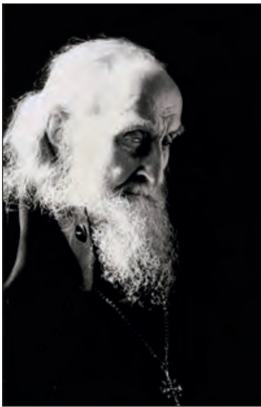
άγιος Σωφρόνιος Σαχάρωφ (1896-1993).

Το μεγαλύτερο πρόβλημα που κληρονόμησε ο 21ος από τον 20ό αιώνα είναι το οικολογικό. Η καταστροφή δηλαδή από τον άνθρωπο των οικοσυστημάτων του πλανήτη και του φυσικού περιβάλλοντος εν γένει. Το φλέγον αυτό ζήτημα το συζητήσαν οι Ορθόδοξες Εκκλησίες κατά την Γ' Προσυνοδική Πανορθόδοξη Διάσκεψη (Γενεύη, 1986). Μετά τα τρία Διορθόδοξα Οικολογικά Συ-