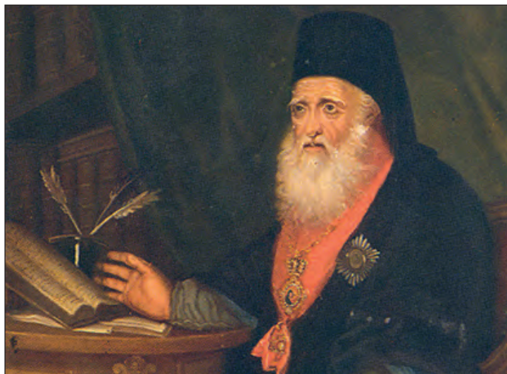
Πορτραίτο του Ευγένιου Βούλγαρη από την Ιακωβάττειο Βιβλιοθήκη. Ληξούρι, Κεφαλονιά.

Ικανός αριθμός αυτών των φωτισμένων Πατέρων ονομάστηκαν Διδάσκαλοι του Γένους. Διακεκριμένος Διδάσκαλος του Γένους υπήρξε π.χ. ο Ευγένιος Βούλγαρης (1716-1806), ο οποίος διορίστηκε σχολάρχης της Αθωνιάδας Σχολής, από τον μαρτυρικό Πατριάρχη της Κωνσταντινούπολης Κύριλλο Λούκαρη. Απογοητευμένος, όμως, από τις συνεχείς αντιδράσεις εναντίον του και από τις δυσκολίες για απρόσκοπτη προαγωγή του έργου του, εγκατέλειψε την Ελλάδα. Αρχές του 1764 πήγε στη Λειψία και ακολούθως στην Αγία Πετρούπολη, όπου χειροτονήθηκε ιερέας. Το 1802 απο-