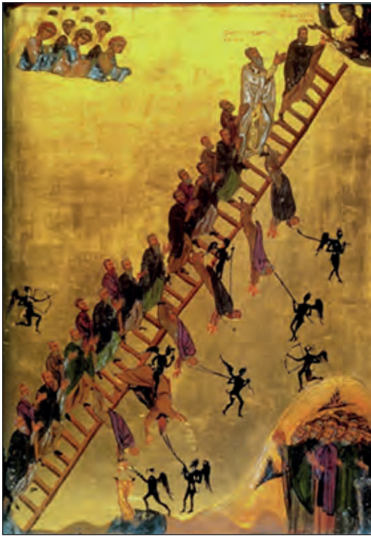
Η Κλίμακα των αρετών. Ι.Μ. Αγίας Αικατερίνης Σινά, 12ος αι.