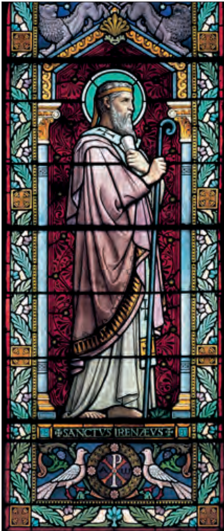
Άγιος Ειρηναίος, I.N. Αγίου Ειρηναίου, 1901. Λυών.

διωγμό που εξαπολύθηκε κατά των χριστιανών επί Σεπτιμίου Σεβήρου.