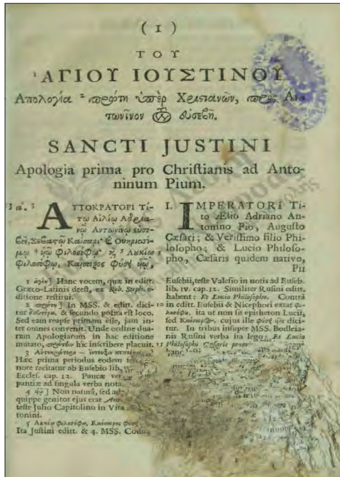
Έκδοση του έργου του Αγίου Ιουστίνου, Άπολογία Πρώτη Ὑπὲρ Χριστιανῶν πρὸς Ἀντωνίνον τὸν Εὐσεβή, 1700 μ.Χ.

Ο Ιουστίνος συνέγραψε τα εξής γνήσια έργα: α'. Α' Άπολογία υπέρ Χριστιανῶν, που απευθύνεται στον αυτοκράτορα Αντωνίνο τον Ευσεβή. β'. Β' Άπολογία υπέρ Χριστιανῶν, που απευθύνεται