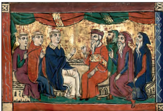
Μέγας Αθανάσιος και Άρειος στη Σύνοδο της Νίκαιας. Γουλιέλμος της Τύρου, μικρογραφία, 12ος αι. https://www.wikiwand.com/en/Athanasius_of_Alexandria

Ο Μ. Αθανάσιος γεννήθηκε στην Αλεξάνδρεια το 295. Ήταν διάκονος του Αρχιεπισκόπου Αλεξανδρείας Αλεξάνδρου κατά την Α΄ εν Νίκαια Οικουμενική Σύνοδο (325). Διαδραμάτισε σημαντικότατο και πρωταγωνιστικό ρόλο τόσο στην προβολή και προάσπιση της διδασκαλίας και των αποφάσεων της Α΄ Οικουμενικής Συνόδου όσο και στον αγώνα κατά του Αρείου και των Αρειανών και στην αντίκρουση των αιρετικών τους απόψεων. Αναδείχθηκε Αρχιεπίσκοπος Αλεξανδρείας το 328 και λόγω της άρνησής του να δεχθεί σε εκκλησιαστική κοινωνία τον Άρειο, και μετά από ενορχηστρωμένες και κατασκευασμένες σε βάρος του ψευδείς κατηγορίες και συκοφαντίες, υπέστη αρκετές ταλαιπωρίες και καταδικάσθηκε σε 5 εξορίες, συνολικού διαστήματος 16 ετών. Παρόλα αυτά παρέμεινε σταθερός και εδραίος στην ορθόδοξη πίστη της Εκκλησίας που δικηρύχθηκε στην Α΄ Οικουμενική Σύνοδο της Νίκαιας, για την οποία αγωνίσθηκε θαρραλέα και σθεναρά μέχρι το θάνατό του, που συνέβη την 2α Μαΐου του 373.