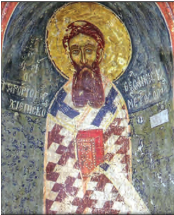
Άγιος Γρηγόριος ο Παλαμάς. Ι.Ν. Τριών Ιεραρχών. Καστοριά, 14ος αι.

Γεννήθηκε το 1296 στην Κωνσταντινούπολη από αριστοκρατική οικογένεια. Φοίτησε στο πανεπιστήμιο της Κωνσταντινούπολης, όπου διδάχθηκε γραμματική, ρητορική, φυσική, λογική και αριστοτελική φιλοσοφία, έχοντας ως δάσκαλο τον διακεκριμένο λόγιο Θεόδωρο Μετοχίτη. Η μοναστική κλήση του Παλαμά καλλιεργήθηκε από τις συναναστροφές του με διάσημους μοναχούς στη βυζαντινή πρωτεύουσα. Σε ηλικία είκοσι ετών περιβλήθηκε το μοναχικό σχήμα και ασκήτευσε στο Άγιον Όρος. Ο Θεόληπτος Φιλαδελφείας τον μύησε στη νοερά προσευχή. Αναγκάστηκε, όμως, από τις περιστάσεις της εποχής, να απομακρυνθεί από την αγαπημένη του ησυχία και να συμμετάσχει στον αντιρρητικό αγώνα υπεράσπισης της παραδοσιακής διδασκαλίας της Εκκλησίας σχετικά με τη διάκριση ουσίας και ενεργειών του Θεού. Το 1347 χειροτονήθηκε Αρχιεπίσκοπος Θεσσαλονίκης και ποίμανε τον λαό θεοφιλώς. Κοιμήθηκε το 1359. Η μνήμη του εορτάζεται στις 14 Νοεμβρίου, και τη δεύτερη Κυριακή των Νηστειών, η