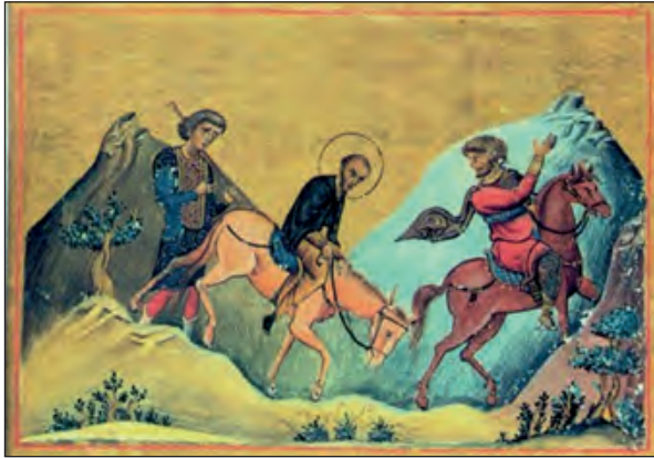
Στο δρόμο προς τα Κόμανα. Μηνολόγιο Βασιλείου Β΄. Κωνσταντινούπολη 985 μ.Χ.

Ο «Χρυσορρήμων» Ιωάννης γεννήθηκε στην Αντιόχεια μεταξύ των ετών 351 (που είναι και το πιθανότερο) και 354. Μετά από εξαιρετικές σπουδές στη φιλοσοφία (με τον Ανδραγάθιο), στη ρητορική (με τον Λιβάνιο) και στη θεολογία στην Αντιόχεια, και μετά από εξαιρετή μονα-