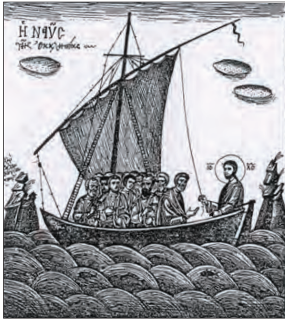
Φώτης Κόντογλου (1895-1965). Η ναυς της Εκκλησίας.

Κάθε σύγχρονος αναγνώστης των Πατερικών κειμένων θα πρέπει να διακρίνει ποια στοιχεία τους είναι διαχρονικά και ποιά καιρικά. Διαχρονικές είναι οι ρήσεις των Πατέρων που περιγράφουν τις αναλλοίωτες, τις δογματικές αλήθειες και αξίες της ορθόδοξης πίστης. Καιρικό ή εποχικό είναι ό,τι συνήθως δεν υπερβαίνει το πλαίσιο της εποχής της συγγραφής του. Για παράδειγμα, οι βυζαντινοί Πατέρες, όταν συμβουλεύουν τους γονείς για το πώς πρέπει να διαπαιδαγωγούν τα τέκνα τους, έχουν υπόψη τους το πρότυπό της οικογένειας, το σύστημα της εκπαίδευσης, την κοινωνική δομή και άλλα δεδομένα της εποχής τους, που είναι πολύ διαφορετικά από τα αντίστοιχα σημερινά. Ο ερμηνευτής των Πατερικών κειμένων οφείλει να διακρίνει ότι το κήρυγμα της Εκκλησίας για την ιερότητα του γάμου και της οικογένειας και για την αγάπη που πρέπει να συνδέει τα μέλη της, παραμένει αναλλοίωτο και διαχρονικό. Ο ερμηνευτής οφείλει, επίσης, κάτω από το γράμμα των Πατερικών κειμένων, να αναζητεί το θεολογικό κλίμα της εποχής τους, τα ρεύματα και τις τάσεις που επηρέασαν την Πατερική γραφίδα. Οφείλει, επίσης, να λαμβάνει υπόψη ότι οι