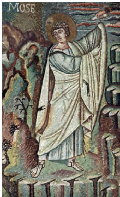
Ο Μωυσής παραλαμβάνει τις Δέκα Εντολές. Βασιλική Αγίου Βιταλίου. Ραβέννα, 6ος αι.

(Γρηγόριος Νύσσης, Εἰς τὸν τοῦ Μωυσέως Βίον. Στὸ Μωσαϊκὴν Ράβδον ... Βιβλικὰ Πατήματα Γ΄ , έκδ. Γραφείου Νεότητος καὶ Κατηχήσεως Ι.Μ. Μεγάρων καὶ Σαλαμίνας, Επτάλοφος ΑΒΕΕ, 2008. Ανακτήθηκε ἀπὸ https://www.oodegr.com/oode/grafi/pd/mwysis_nyssid_l.htm )