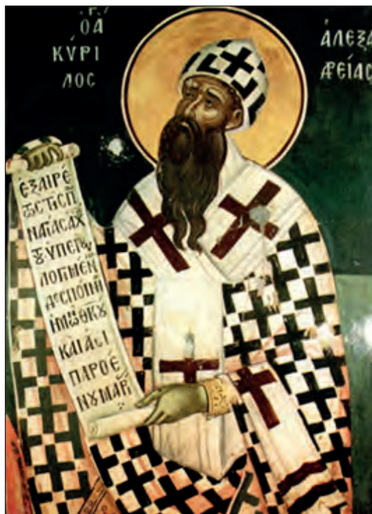
Άγιος Κύριλλος Αλεξανδρείας, Θεοφάνης ο Κρης και Συμεών, 1546. Παρεκκλήσιο Αγίου Νικολάου, Ι.Μ. Σταυρονικήτα, Άγιον Όρος.