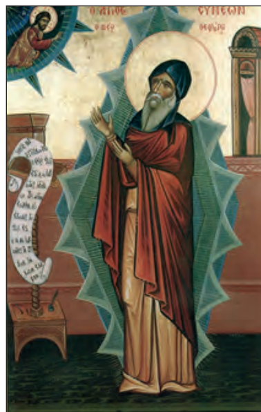
Συμεών ο Νέος Θεολόγος

Συμεών ο Νέος Θεολόγος, 'Υμνοι, ΚΘ', ΕΠΕ, έκδ. Μερετάκη «Το Βυζάντιον», Πατερικαὶ ἐκδόσεις Γρηγόριος ὁ Παλαμᾶς, Θεσσαλονίκη, 1989, σσ. 34-57 (επιλογή)