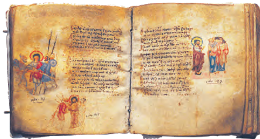
Περγαμνό Ψαλτήριο. Κώδικας 61. I.M. Παντοκράτορος, Άγιον Όρος, 9ος αι.

Κατ' αυτήν την περίοδο εμφανίζεται μία πρώιμη υμνογραφία. Ήδη κατά τους αποστολικούς χρόνους, και πριν από τη συγγραφή των Ευαγγελίων, γίνεται ευρεία χρήση των Ψαλμών του Δαβίδ, ενώ ταυτόχρονα συντάσσονται διάφοροι ύμνοι από τους μαθητές του στενού, αλλά και του ευρύτερου περιβάλλοντος του Χριστού. Κάποιοι εξ αυτών καταχωρήθηκαν αυτούσιοι στα Ευαγγέλια, όπως οι Ωδές της Θεοτόκου (Λκ. 1, 46-55), του Ζαχαρία (Λκ. 1, 67-79) και του Συμεών (Λκ. 2, 29-32). Σύν τω χρόνω, βέβαια, μεταξύ των ψαλμικών στίχων ή των στίχων των Ωδών άρχισαν να παρεμβάλλονται μικρές επωδοί (εφύμνια), που εξελίχθηκαν αργότερα σε τροπάρια.