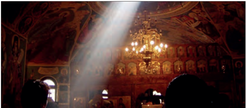
«Από την καθαρή προσευχή γεννιέται η αληθινή αγάπη» (π. Κλεόπας Ηλίε) https://www.ekklisiaonline.gr/wp-content/uploads/2017/06/z-10.jpg