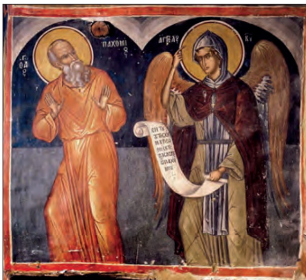
Άγγελος Κυρίου, ντυμένος ως μοναχός, υπαγορεύει στον Όσιο Παχώμιο τους κανόνες του κοινοβιακού μοναχισμού. http://www.saint.gr/1592/saint.aspx

Από τους πρώτους χριστιανικούς αιώνες, άρχισε να αναπτύσσεται ο «αναχωρητισμός», ένα είδος πολύ αυστηρής άσκησης. Οι αναχωρητές εγκατέλειπαν τις κοσμικές φροντίδες και απομονώνονταν σε ερημικές περιοχές. Ζούσαν με ελάχιστα μέσα, πολλές στερήσεις και αφιέρωναν τη ζωή τους στην προσευχή. Σταδιακά άρχισαν να δημιουργούνται οργανωμένες κοινότητες ασκητών, δηλαδή μοναχικές αδελφότητες, με επικεφαλής έναν κοινό πνευματικό πατέρα και καθοδηγητή, τον Ηγούμενο. Ηγετική μορφή του κοινοβιακού μοναχικού βίου στην περιοχή της Αλεξάνδρειας της Αιγύπτου υπήρξε ο Μέγας Αντώνιος. Ήταν τέτοια η πνευματική ακτινοβολία του, ώστε ο Άγιος Αθανάσιος, επίσκοπος Αλεξανδρείας, τον οποίο η Εκκλησία αποκαλεί, επίσης, «Μέγα», συνέγραψε τη βιογραφία του Αντωνίου και τον ονόμασε «Καθηγητή της ερήμου». Ο Μέγας Αντώνιος, κυρίως όμως ο μεταγενέστερός του μοναχός Παχώμιος, υπήρξε ο διαμορφωτής του κοινοβιακού μοναχισμού.