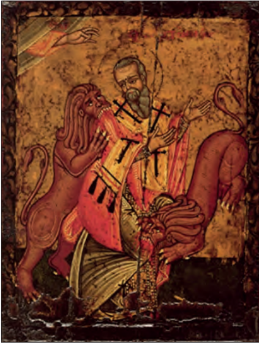
Μαρτύριο Αγίου Ιγνατίου, 17ος αι. Μουσείο Πούσκιν, Μόσχα.

του είναι γνωστή και μία Β΄ Έπιστολή πρὸς Κορινθίους, η οποία όμως δεν είναι γνήσιο έργο του. Τα θέματα της διδασκαλίας του αναφέρονται στην τήρηση της ειρήνης και της ομόνοιας στη ζωή της Εκκλησίας, στην άσκηση της αγάπης, της σύνεσης, της υπακοής, της μετάνοιας και της ταπεινοφροσύνης. Κάνει επίσης λόγο για την πίστη στην ανάσταση των νεκρών και για τη λειτουργία του πολιτεύματος της Εκκλησίας με τη χρήση των όρων Επίσκοποι ή Πρεσβύτεροι και Διάκονοι .