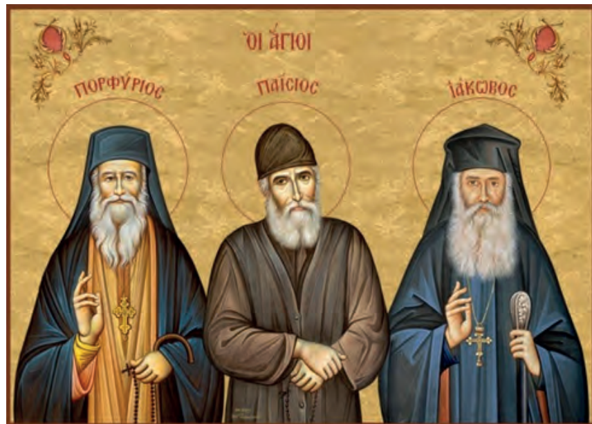
Οι Άγιοι Πορφύριος, Παΐσιος και Ιάκωβος. Σύγχρονη εικόνα.

Η θεολογία οφείλει πολλά στους Πατέρες της Εκκλησίας που έζησαν και έδρασαν τον 20ό αιώνα. Υπήρξαν ποιμένες με αγιότητα βίου, ορθόδοξη θεολογική σκέψη και σημαντικό έργο στους τομείς της δογματικής, της λατρευτικής και μυστικής διάστασης της θεολογίας. Ο άγιος Νεκτάριος (1846-1920) σε ηλικία τριάντα ετών εκάρη μοναχός, ενώ έλαβε την ιεροσύνη από τον Πατριάρχη Σωφρόνιο Αλεξανδρείας. Το 1889 ανέβηκε στον επισκοπικό θρόνο της Πενταπόλεως. Ο άγιος Νεκτάριος αντιμετώπισε μεγάλες δυσκολίες στη ζωή του και κατασυκοφαντήθηκε. Η υπομονή όμως με την οποία αντιμετώπιζε τους πειρασμούς και η ανεξικακία του έναντι όλων όσοι των εκθρεύονταν, τον ανέδειξε Άγιο της Εκκλησίας. Υπήρξε πολυγραφότατος με πλούσιο θεολογικό, ποιμαντικό, αλλά και υμνολογικό έργο. Ο άγιος Ιουστίνος Πόποβιτς (1894-1979) υπήρξε σπουδαίος θεολόγος που επηρέασε σημαντικά τη μεταγενέστερη θεολογική σκέψη. Κατόρθωσε να μετουσιώσει τη θεολογική εμπειρία της χριστιανικής παράδοσης σε σύγχρονο θεολογικό λόγο. Συνεχιστής της Πατερικής Παράδοσης της Εκκλησίας υπήρξε και ο άγιος Σωφρόνιος του Έσσεξ (1896-1993), του οποίου η θεολογία έδωσε νέα πνοή στα θεολογικά γράμματα.