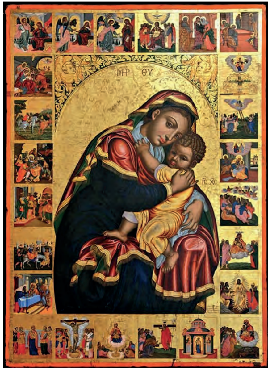
Παναγία του Ακάθιστου Ύμνου (1700). Έργο του Κρητικού αγιογράφου Στέφανου Τζαγκαρόλα. Χαρακτηριστικό δείγμα της λεγόμενης «Κρητοεπτανησιακής Σχολής». Εκκλησιαστικό Μουσείο Ι.Μ. Αποστόλου Ανδρέα Μηλαπιδιάς (παλιό Καθολικό), Κεφαλονιά.

β) Ιωάννης Δαμασκηνός (680-755). Μεγάλος δογματολόγος της Εκκλησίας, έγραψε τα τροπάρια της Νεκρώσιμης ακολουθίας, τους ιαμβικούς Κανόνες Χριστουγέννων και Θεοφανείων, καθώς και τους Κανόνες Κυριακής του Πάσχα, Θεοφανείων, Μεταμορφώσεως και Κοίμησης της Θεοτόκου. Θεωρείται, επίσης, ο συντάκτης της Οκτωήχου.