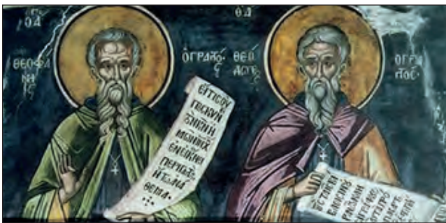
Άγιοι Θεοφάνης και Θεόδωρος, οι «Γραπτοί». I.M. Διονυσίου, Άγιον Όρος, 16ος αι. (Κρητική Σχολή).

βασανιστήρια, επειδή υπερασπίστηκαν την τιμή και την προσκύνηση των εικόνων. Ο άγιος Ανδρέας, Αρχιεπίσκοπος Κρήτης (660-740), ένας από τους μεγαλύτερους ποιητές, ρήτορες και συγγραφείς του Βυζαντίου ήταν υπέρμαχος των ιερών εικόνων. Ο Ιεράρχης, που αφιέρωσε τη ζωή του στη διαποίμανση της Εκκλησίας της Κρήτης και ανέπτυξε τεράστιο φιλανθρωπικό έργο, σε προχωρημένη ηλικία επισκέφθηκε την Κωνσταντινούπολη για να υπερασπιστεί την ορθόδοξη πίστη απέναντι στον Λέοντα Γ΄ τον Ίσαυρο. Το ταξίδι αυτό τον καταπόνησε με αποτέλεσμα να αποβιώσει κατά τη διάρκεια της επιστροφής του στην Κρήτη. Στα Ιεροσόλυμα, όπου έλαβε τη μοναχική κουρά ο Ανδρέας Κρήτης, γαλουχήθηκαν με την ορθόδοξη πίστη και οι αυτάδελφοι Θεόδωρος (775-836) και Θεοφάνης (778-845), οι οποίοι υπήρξαν σπουδαίοι υμνογράφοι της Εκκλησίας. Και οι δύο έζησαν για λίγα χρόνια ως μο-