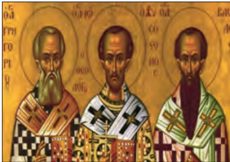
Γρηγόριος Θεολόγος, Ιωάννης Χρυσόστομος, Μέγας Βασίλειος.

Βασικά σημεία της διδασκαλίας του: Ο Μ. Αθανάσιος εστιάζει και επικεντρώνει τη θεολογική του διδασκαλία στην ανάδειξη και διακήρυξη της θεότητας του Υιού και στην προβολή της δογματικής άποψης ότι ο Υιός είναι ομοούσιος και συναΐδιος με τον Πατέρα. Ο Υιός δεν είναι «κτίσμα» ή «ποίηση» του Πατρός ούτε είναι κατώτερος του Πατρός, όπως κακόδοξα ισχυριζόταν ο Άρειος, αλλά είναι ίσος με τον Πατέρα και «άκτιστος» κατά την προαιώνια ύπαρξή του. Γεννάται προαιωνίως «κατά φύσιν» εκ του Πατρός και είναι συνδημιουργός με τον Πατέρα και το Άγιο Πνεύμα όλης της κτιστής (νοητής και αισθητής) φύσης. Είναι ο πρώτος μεγάλος Πατήρ της Εκκλησίας που διακηρύσσει τη θεότητα του Αγίου Πνεύματος. Στη Χριστολογική του διδασκαλία επισημαίνει εμφαντικά ότι ο Θεός Λόγος, χωρίς να μεταβληθεί κατά τη θεία του φύση, ενανθρώπησε, δηλαδή έλαβε σάρκα με ψυχή λογική, προκειμένου να επιτευχθεί η σωτηρία και θέωση του ανθρώπου.