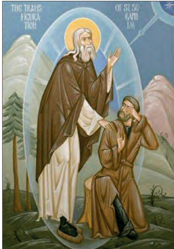
Η συζήτηση του Αγίου Σεραφεΐμ με τον Νικολάι Μοτοβίλοφ. Σύγχρονη ρωσική εικόνα.

(Φώτης Κόντογλου, Ο Πολυαγαπημένος Άγιος Σεραφεΐμ του Σάρωφ, Γίγαντες ταπεινοί, Ακρίτας 2000. Ανακτήθηκε από http://users.uoa.gr/~nektar/arts/tributes/fwths_kontogloy/o_agios_serafeim_toy_sarwf.htm )