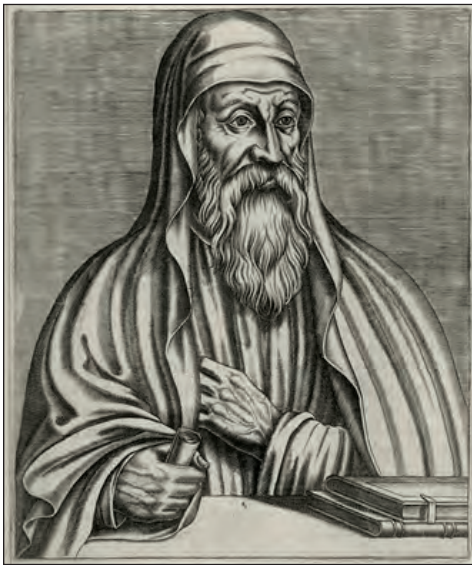
Ωριγένης. Απεικόνιση σε γαλλικό βιβλίο του 16ου αι.

Σύμφωνα με τη διδασκαλία του Κλήμη του Αλεξανδρέα οι Έλληνες φιλόσοφοι εξομοιώνονται με τους προφήτες της Παλαιάς Διαθήκης. Ο κόσμος είναι απόρροια και αποτέλεσμα της αγάπης και της θέλησης του Θεού και δημιουργείται από αυτόν διά του Λόγου. Η Εκκλησία κατά τον Κλήμη είναι ουράνια και επίγεια και χαρακτηρίζεται ως «σύλλογος σεσωσμένων».