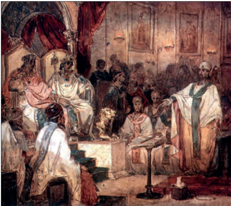
Η Δ΄ Οικουμενική Σύνοδος της Χαλκηδόνας, Vasily Surikov, 1876, Αγία Πετρούπολη.

Ως ακόλουθος του αυτοκράτορα, αμέσως μετά το τέλος της Δ΄ Οικουμενικής Συνόδου που έλαβε χώρα το 451 μ.Χ. στη Χαλκηδόνα, πήρες στα χέρια σου την τελική απόφαση των Αγίων Πατέρων. Λαμβάνοντας υπόψη σου και τα όσα προηγήθηκαν της Συνόδου, να ετοιμάσεις ένα σύντομο γραπτό ρεπορτάζ το οποίο θα ανακοινωθεί άμεσα στους υπηκόους της αυτοκρατορίας.