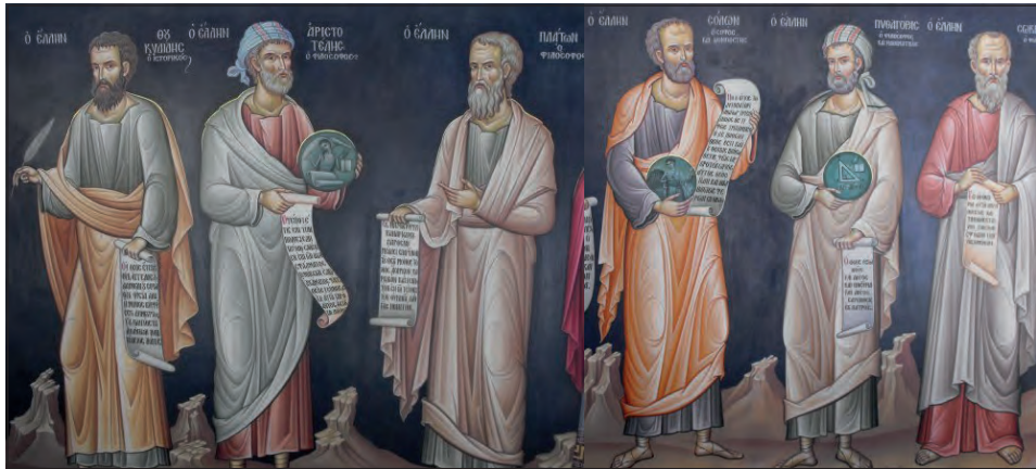
Τοιχογραφίες από τον προαύλιο χώρο της Ιεράς Μονής Μεγάλου Μετεώρου.

Με βάση τα όσα μάθαμε, για αυτά που είπε και έγραψε ο Κλήμης ο Αλεξανδρέας, πιστεύετε ότι μπορούμε να απεικονίζουμε τους αρχαίους Έλληνες φιλοσόφους σε έναν ιερό χώρο, όπως για παράδειγμα είναι εδώ ο εξωτερικός χώρος της Ι.Μ. Μεταμορφώσεως του Σωτήρος (Μεγάλου Μετεώρου) και γιατί; Ποια σχέση μπορεί να έχουν η «γνώση» με την «πίστη»; Μήπως το ένα αναιρεί το άλλο; Τι θα έλεγε σήμερα ο Κλήμης ο Αλεξανδρέας για αυτό το θέμα;