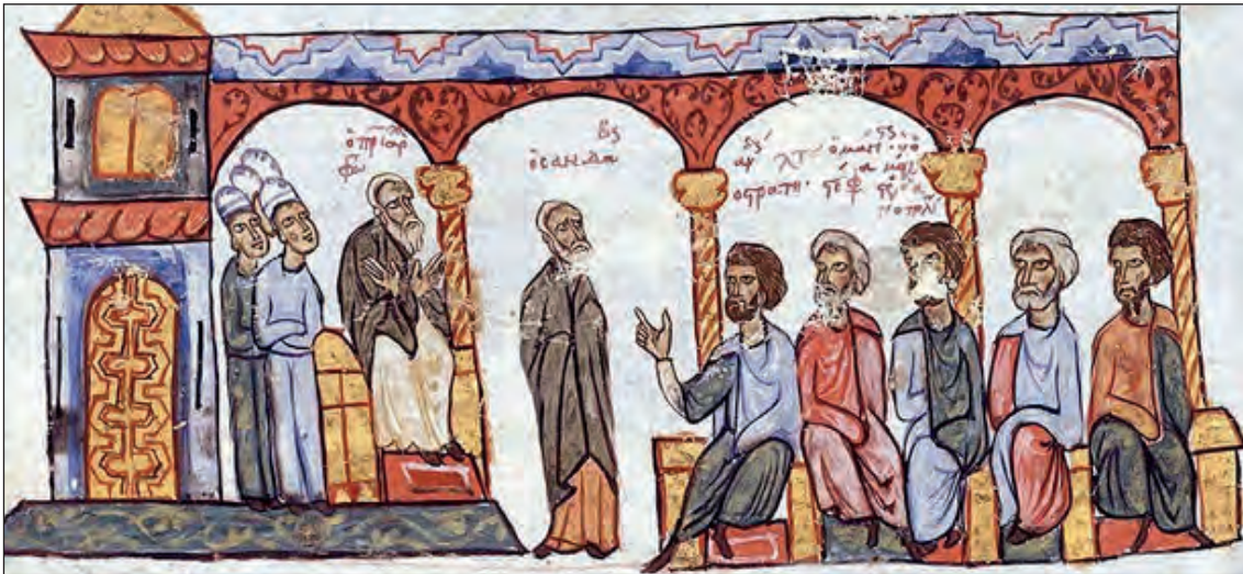
Ο Μέγας Φώτιος στον πατριαρχικό θρόνο. Μικρογραφία στο έργο Σύνοψις Ἱστοριῶν του Ἰωάννη Σκυλίτση. Εθνική βιβλιοθήκη της Ισπανίας, 1081 μ.Χ.

Η κακόδοξη αυτή ερμηνευτική αντίληψη του Filioque άρχισε αργότερα - από τον 12ο αιώνα μέχρι και την εποχή της Αλώσεως της Κωνσταντινουπόλεως (1453)- να υποστηρίζεται και να προβάλλεται και από ορισμένους λατινόφρονες εκκλησιαστικούς συγγραφείς στον χώρο της Ορθόδοξης Ανατολικής Εκκλησίας· οι λατινόφρονες αυτοί, που ήταν και ενωτικοί θεολόγοι, επιδίωκαν και με αυτή τη διατύπωση (είτε με τη μορφή «καὶ ἐκ τοῦ Υἱοῦ», είτε με τη μορφή «διὰ τοῦ Υἱοῦ») την επίτευξη της ένωσης των Εκκλησιῶν. Την κακόδοξη αυτή άποψη του Filioque αντιμετώπισαν σθεναρά και αναίρεσαν με αξιολογότατα και εντυπωσιακά θεολογικά επιχειρήματα μεγάλοι Πατέρες και Οικουμενικοί Διδάσκαλοι της Εκκλησίας στον χώρο της Ανατολής. Ενδεικτικά, πρώτος ο Μέγας Φώτιος (9ος αιώνας) εγκαινίασε με αξιοθαύμαστη και εκπληκτική θεολογική επιχειρηματολογία αυτήν την αντιλατινική συγγραφική δραστηριότητα, που απέβλεπε στην αντίκρουση και αναίρεση του Filioque. Με λαμπρή και ακαταμάχητη θεολογική επιχειρηματολογία ο ιερός Πατήρ ανασκεύασε και κατέρριψε όλα τα λατινικά επιχειρήματα για την αποδοχή του Filioque. Τον αγώνα αυτόν εναντίον της λατινικής καινοτομίας του Filioque συνέχισαν με την ίδια σπουδαία θεολογική επιχειρηματολογία και επιτυχία μεγάλοι Πατέρες και θεολόγοι της Ορθόδοξης Εκκλησίας, όπως, πολύ ενδεικτικά, ο Νικόλαος Μεθώνης (12ος αιώνας), ο Γρηγόριος Β΄ ο Κύπριος (13ος αιώνας), ο Γρηγόριος ο Παλαμάς (14ος αιώνας), ο Νείλος Καβάσιλας (14ος αιώνας) και ο Μάρκος Εφέσου ο Ευγενικός (15ος αιώνας).