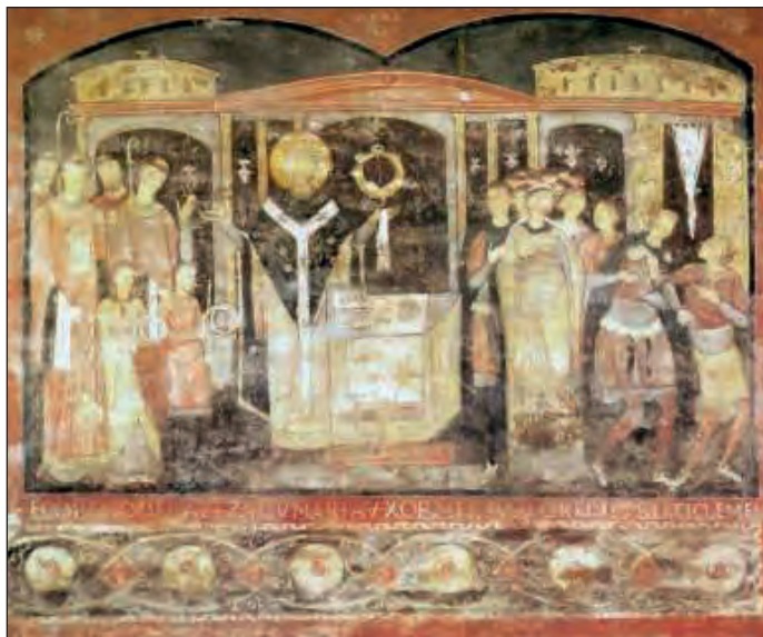
Ο Άγιος Κλήμης τελεί τη Θεία Λειτουργία. Τοιχογραφία στη Βασιλική του Αγίου Κλήμεντος. Ρώμη, 11ος αι.

Α. Ο Κλήμης Ρώμης, πιθανώς Χριστιανός εξ Ιουδαίων, ήταν επίσκοπος Ρώμης κατά τα έτη 92-101. Έγραψε μία Επιστολή προς Κορινθίους ( Α΄ Έπιστολή πρὸς Κορινθίους ). Υπό το όνομά