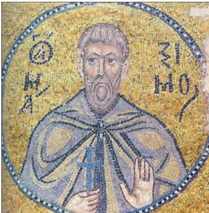
Άγιος Μάξιμος ο Ομολογητής, ψηφιδωτό. Νέα Μονή Χίου, 11ος αι.

Την αιρετική αυτή μονοθελητική άποψη καταπολέμησαν έντονα και αναίρεσαν με την αξιόλογη θεολογική τους επιχειρηματολογία δύο μεγάλοι Πατέρες της Εκκλησίας, ο Πατριάρχης Ιεροσολύμων Σωφρόνιος (564-638) και κυριότερα ο Μάξιμος ο Ομολογητής (580-662). Και οι δύο αυτοί σπουδαιότατοι θεολόγοι Πατέρες της Εκκλησίας τόνισαν στη διδασκαλία τους ότι εφόσον ο Ιησούς Χριστός έχει δύο φύσεις, τη θεία και την ανθρώπινη, πρέπει να γίνει αποδεκτό και να διακηρυχθεί ότι έχει δύο διακρινόμενα φυσικά θελήματα, το θείο και το ανθρώπινο. Επί τη βάση της διδασκαλίας ειδικότερα του Μαξίμου του Ομολογητού η εν Τρούλλῳ ΣΤ΄ Οικουμενική Σύνοδος στην Κωνσταντινούπολη (680-681) διατύπωσε στον Όρον της τη δογματική διδασκαλία ότι ο Ιησούς Χριστός έχει δύο φυσικά θελήματα και δύο φυσικές ενέργειες, τη θεία και την ανθρώπινη, και ότι το ανθρώπινο θέλημα δεν αντιτίθεται ούτε αντιστρατεύεται το θείο θέλημα, αλλά υποτάσσεται σε αυτό.