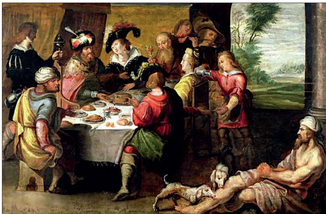
Ο Λάζαρος και ο Πλούσιος. Φρανς Φράνκεν ο νεότερος, 17ος αι. Μουσείο τέχνης, Καμπραί, Γαλλία. https://paintingvalley.com/lazarus-and-the-rich-man-painting#lazarus-and-the-rich-man-painting-22.jpg

κατάλληλες προσπάθειες και ενέργειες απέτρεψε πολλές περιπτώσεις αρπαγής νεαρών Ελληνίδων από τους Τούρκους και βίαιου εξισλαμισμού τους. Σε διάφορους χώρους ιδιοκτησίας της και στο ονομαστό μοναστήρι της, όπου έβρισκαν ανακούφιση και θαλπωρή αναξιοπαθούντες κάτοικοι της ευρύτερης περιοχής, ανήγειρε διάφορα οικοδομήματα, όπως φιλανθρωπικά ιδρύματα, νοσηλευτήρια και ορφανοτροφεία, καθώς και σχολεία.