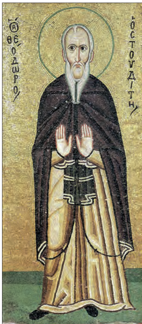
Θεόδωρος ο Στουδίτης, Ψηφιδωτό. Ι.Μ. Οσίου Λουκά Βοιωτίας, 11ος αι.