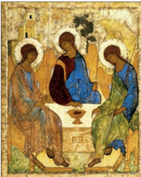
Η Αγία Τριάδα, Αντρέι Ρουμπλιώφ, 1425. Πανακοθήκη Τετριάκοφ, Μόσχα.