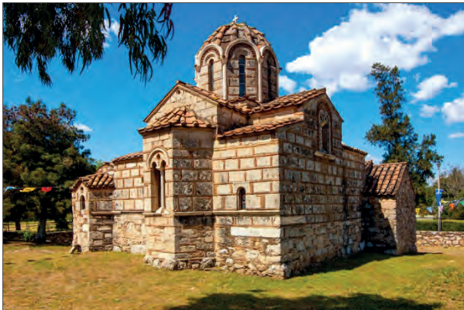
Ομορφοκκλησιά (Άγιος Γεώργιος), 12ος αι. Γαλάτσια Αττικής.

Για να υπάρχει μέλλον στην ανθρωπότητα, για να μη χαθεί ο άνθρωπος, πρέπει ο κόσμος να αντιταχθεί σε ό,τι εχθρεύεται ή απειλεί να αφανίσει την κορωνίδα της δημιουργίας. Ο ευδαιμονισμός, ο ατομισμός, η λατρεία του χρήματος είναι, σύμφωνα με τη θεολογία των Πατέρων, μορφές σκοταδισμού. Η Εκκλησία, μέσω των ποιμένων και διδασκάλων της, οφείλει να ενεργεί και σήμερα όπως ενεργούσε πάντοτε. Να κηρύττει και να θεολογεί με πειθώ για να αφυπνίσει τον άνθρωπο, εγείροντάς τον από τον πνευματικό λήθαργο. Να τον θέσει ενώπιον των ευθυνών του και των κινδύνων που εγκυμονούν αρνητικά μεγέθη, όπως είναι ο άκριτος τεχνολογισμός, ο άκρατος καταναλωτισμός και η ξέφρενη διατάραξη της οικολογικής ισορροπίας και της ανεπίτρεπτης καταστροφής του οικοσυστήματος. Η Εκκλησία οφείλει να δείξει στον κόσμο με πειθώ και απόλυτη συνέπεια τον δρόμο της επιστροφής στη Θεία κοινωνία της Δικαιοσύνης και της Αγάπης.