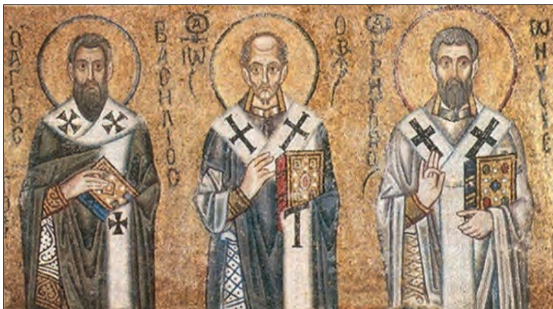
Μέγας Βασίλειος, Ιωάννης Χρυσόστομος και Γρηγόριος Νύσσης. Ψηφιδωτό. Καθεδρικός Ι. Ν. Αγίας Σοφίας, Κίεβο, 11ος αι.

Τον ίδιο αιώνα εμφανίσθηκε η κακόδοξη άποψη του Απολιναρίου, σύμφωνα με την οποία κατά την ενανθρώπησή του ο Λόγος του Θεού προσέλαβε μόνο το σώμα και την «άλογη» ψυχή του ανθρώπου -δηλαδή την ψυχή χωρίς τον νου, τη λογική-, και ότι τη θέση του λογικού μέρους της ψυχής (δηλαδή του νου, της λογικής ψυχής) κατέλαβε ο Λόγος του Θεού. Την άποψη αυτή κατέκριναν έντονα και την ανασκεύασαν με ισχυρή θεολογική επιχειρηματολογία ιδιαίτερα οι τρεις Καππαδόκες Πατέρες (Μ. Βασίλειος, Γρηγόριος ο Θεολόγος και Γρηγόριος Νύσσης). Υπογραμμίσθηκε από αυτούς ότι αν ο Θεός Λόγος δεν προσλάμβανε κατά την ενανθρώπησή του ολόκληρη την ανθρώπινη φύση, δηλαδή το σώμα μαζί με τη λογική ψυχή (αυτήν που έχει νου και λογική), τότε δεν θα σώζονταν κατά το απολυτρωτικό έργο του Ιησού Χριστού καθ' ολοκληρίαν οι ψυχές των ανθρώπων, δηλαδή και κατά το λογικό μέρος τους. Στην περίπτωση αυτή η σωτηρία του ανθρώπου θα ήταν χωρίς νόημα και κάτι το μη πραγματικό και θα καταντούσε μία αφηρημένη θεωρία χωρίς περιεχόμενο.