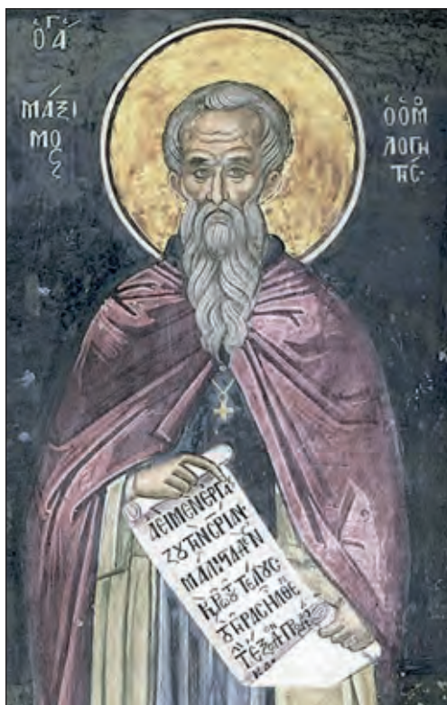
Άγιος Μάξιμος ο Ομολογητής.

Τομή στη νηπτική και τη μυστική θεολογία αποτελεί η διδασκαλία για τη «μέθεξη των Θείων ενεργειών» του Γρηγορίου Παλαμά, συνεχιστής του οποίου υπήρξε ο Νικόλαος Καβάσιλας (1322-1391), πολυγραφότατος και πληθωρικός συγγραφέας. Στους επτά λόγους του Περὶ τῆς ἐν Χριστῷ ζωῆς κυριαρχεί η ιδέα ότι η μέθεξη στη Θεία Χάρη είναι εφικτή μέσω της ησυχαστικής μεθόδου και της μετοχής στα Μυστήρια της Εκκλησίας και ιδίως στη Θεία Ευχαριστία.