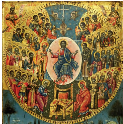
Η Σύναξη των Αγίων Πάντων. Στο https://mikraeortologika.blogspot.com/2017/06/blog-post_11.html

«Είναι, λοιπόν, ο Παράδεισος ζωή χωρίς θάνατον, διότι εκεί ζεις με την ίδια τη ζωή του Θεού· μένεις με την ίδια τη διαμονή του Θεού· είσαι με το ίδιο το είναι του Θεού· ζεις, όσο ζει ο Θεός. Χαρά χωρίς τέλος, διότι εσύ χαίρεσαι με την ίδια τη χαρά του Θεού· βασιλεύεις κι εσύ με την ίδια βασιλεία του Θεού· δοξάζεσαι με την ίδια τη δόξα του Θεού· με λίγα λόγια, βλέποντας τον Θεό γίνεσαι άλλος Θεός·