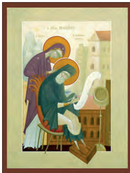
Ο Άγιος Νεκτάριος συγγράφων ύμνους προς την Παναγία. Δια χειρός Φίκου, 2013.

Οι ύμνοι, και ιδιαίτερα οι Κανόνες, αποτυπώνουν τη θεολογική διδασκαλία της Εκκλησίας με σαφώς δογματικό περιεχόμενο (Τριαδολογία, Χριστολογία, Θεοτοκολογία κ.λπ.). Ήδη οι συνθέτες τους ήταν οι περισσότεροι μεγάλοι θεολόγοι, οι οποίοι κατά τον ένα ή τον άλλο τρόπο αγωνίστηκαν για την απόκρουση αιρετικών θεολογικών διδασκαλιών και επομένως για την κατοχύρωση του ορθού δόγματος. Τις θέσεις τους τις διατύπωσαν ποιητικά και τις επένδυσαν μουσικά προσφέροντάς τες υπό μορφή ύμνων. Κατά παρόμοιο τρόπο έγραψαν και οι υπόλοιποι εκκλη-