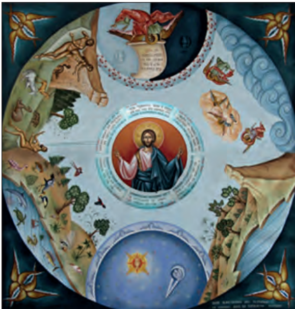
Η δημιουργία του κόσμου.

Η Ορθοδοξία και το πρόβλημα της προστασίας του φυσικού περιβάλλοντος «Μέσα στη γενική αυτή βραδύτητα, με την οποία συνειδητοποιείται στις μέρες μας η σοβαρότητα του προβλήματος της προστασίας της φύσεως, κινείται και η χριστιανική Εκκλησία. Είναι δυστυχώς πολλοί εκείνοι που διερωτώνται γιατί να ασχολούμεθα οι Χριστιανοί με το λεγόμενο "Οικολογικό Πρόβλημα". Οι κατηγορίες των Χριστιανών που σκέπτονται κατ' αυτόν τον τρόπο είναι κυρίως δύο. Είναι πρώτα εκείνοι που πιστεύουν ότι σκοπός της Εκκλησίας του Χριστού είναι η σωτηρία των ψυχών και μόνον: Κάθε τι το υλικό είναι γι' αυτούς δευτερεύον, αν όχι εμπόδιο για τη σωτηρία της ψυχής. Για τους χριστιανούς αυτούς ο υλικός κόσμος είναι προσωρινός και προορισμένος να αντικατασταθεί στη βασιλεία του Θεού με ένα κόσμο άυλο ή πνευματικό. Η δεύτερη κατηγορία των Χριστιανών που αδιαφορούν για το οικολογικό πρόβλημα είναι εκείνοι που πιστεύουν ότι το πρόβλημα στη φύση του είναι πολιτικό, επιστημονικό και τεχνοκρατικό. Τι δουλειά έχουν η Εκκλησία και η Θεολογία με το θέμα αυτό; Ας το αντιμετωπίσουν οι πολιτικοί και οι επιστήμονες. Η Εκκλησία και η θεολογία έχουν άλλου