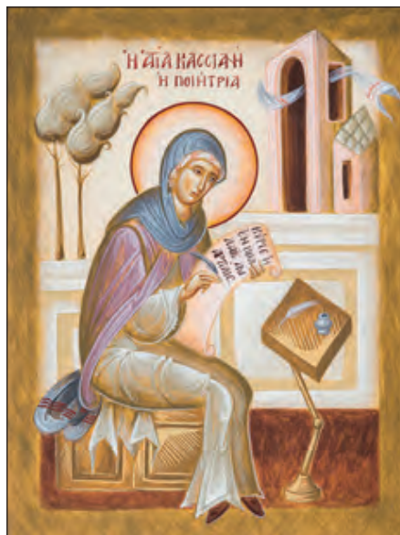
Αγία Κασσιανή η ποιήτρια, Julia Hayes. https://www.ikonographics.net/

ε) Ιωσήφ ο Ὑμνογράφος (816-886). Οι Κανόνες και τα στιχηρά που έγραψε συνέβαλαν στη διαμόρφωση της Παρακλητικής.