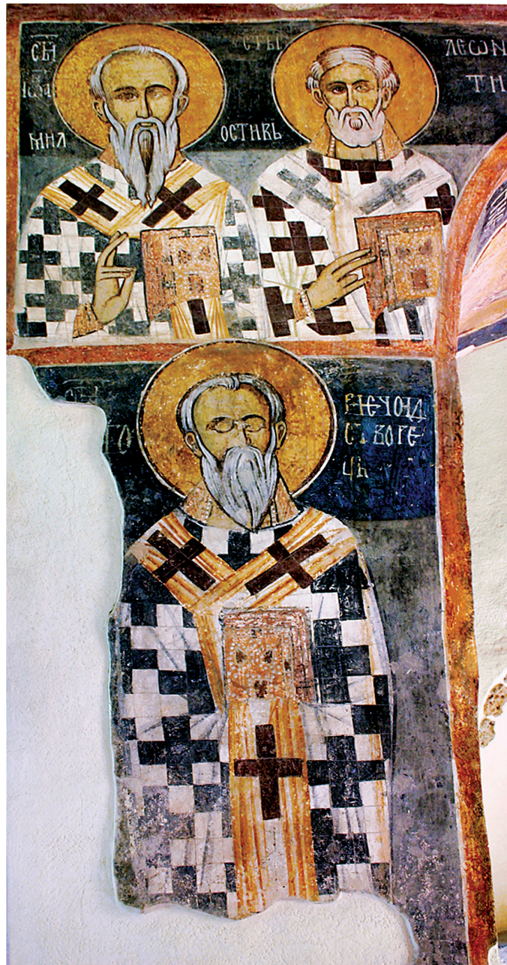
Οι ἅγιοι Γρηγόριος Νεοκαισαρείας, Ἰωάννης ο Ελεήμων, και Λεόντιος, τοιχογραφία (14ος αἰ.), καθολικό της ιερᾶς μονῆς Ἁγίου Ἰωάννου του Θεολόγου, Ζεμεν (Βουλγαρία)

σαγωγή: Ιστορική Εισαγωγή εἰς τους Κανόνας της Ορθοδόξου Ἐκκλησίας , Στοκκόλμη 1990. Χρήστου, Π., Ἑλληνική Πατρολογία , τ. Β', Θεσσαλονίκη: Κυρομάνος 1991. Παπαδόπουλος, Σ., Πατρολογία , Α', Αθήνα 1991. LThK 4 (1995) 1027-1029. Δετοράκης, Θ., Βυζαντινὴ Φιλολογία , τ. Α', Ἠράκλειο 1995. Σκουτέρης, Κ., Ιστορία Δογμάτων , Α', Αθήνα 1998. Clausi B., "L'altro Gregorio. Intorno alla tradizione agiografica latina sul thaumaturgo", στον τόμο B. Clausi - V. Milazzo (ἐπιμ.), Il giusto che fiorisce come palma. Gregorio il Thaumaturgo