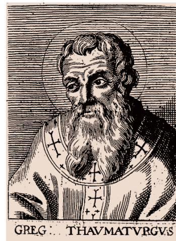
Ο άγιος Γρηγόριος Νεοκαισαρείας

Κατά τον διωγμό του Δεκίου (250) συμβούλεψε πολλούς χριστιανούς να καταφύγουν στα ὄρη προκειμένου να αποφύγουν τη σύλληψη και καταδίκη ή και την αποστασία. Τη συμβουλή αυτήν εφάρμοσε και ο ίδιος, ενώ με τη λήξη του διωγμού ὀρισε ετήσια εορτή προς τιμὴν ὧσων μαρτύρησαν (ό.π., PG 46:953AB).