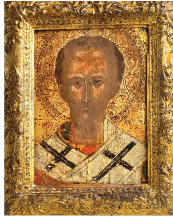
Άγιος Ιωάννης ο Χρυσόστομος, εικόνα της Κρητικής Σχολής (17 ος αι.), ιδιωτική συλλογή, Μόντρεαλ (Καναδάς)

και αποκτά αμετάβλητη στερρότητα μόνο διά της πνευματεμορφίας. Η παροχή της Χάριτος αποτελεί ενοίκηση των ενεργειών του Πνεύματος και όχι της ουσίας του. Ο Χρυσόστομος, ως ανακεφαλαιωτής των Καππαδοκών Πατέρων, αποτέλεσε τη γέφυρα της πατερικής θεολογίας από την κλασική της περίοδο στα μετέπειτα βήματα της νηπιτικής και μυστικής θεολογίας, τον ψευδο-Διονύσιο, τον Μάξιμο Ομολογητή