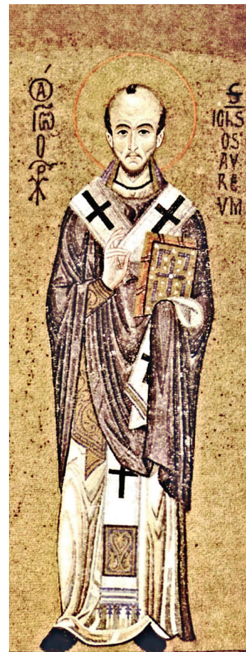
Ιωάννης ο Χρυσόστομος, ψηφιδωτό (περ. 1140), Cappella Palatina, Παλέριο, Σικελία

πρόσωπο του Χριστοῦ. Ο Χρυσόστομος χρησιμοποιεῖ συστηματικῶς τοὺς ὀρους 'συνάφεια' καὶ 'ἐνώσει' θείας καὶ ἀνθρώπινης φύσεως, ὅταν ἀναφέρεται στὸν Σαρκομένο Λόγο, καὶ ἀποκλείει τὴν τροπὴ ἢ τὴ σύχυση των δύο φύσεων. Με τὴν Ἐνανθρώπησὴν ὁ σάρκα-ἀνθρωπότητα ἐκπληρώνει τὸν προορισμὸ της ἀναμαρτυρίας καὶ της ἀθανασίας. Πάντως, λόγω της ἀντιοικειανῆς παραδόσεως, στὴν ὁποία ἀνήκει καὶ ἐχει ἀνατραφεῖ, ἀποφεύγει τὴ χρῆσὴ τοῦ ὀρου 'θεοτόκος'.