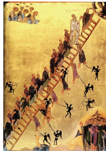
Η κλίμαξ του Παραδείσου, φορητή εικόνα (12ος αι.), μονή Αγίας Αικατερίνης Σινά

σταδιακά ανεκτικική. Ο αγωνιζόμενος στο άθλημα της μοναχικής ασκήσεως ανέρχεται προοδευτικά σε ανώτερα επίπεδα πνευματικότητας, με ύψιστο αυτό της τελειώσεως. Δια της μεταβάσεως από τα χαμηλότερα στα υψηλότερα πνευματικά στάδια, όπως αυτή σκιαγραφείται στην ουρανόδρομο Κλίμακα , ο πιστός καταπολεμά σταδιακά τα επτά θανάσιμα αμαρτήματα, την αλαζονεία, τη φιλαργυρία, τον φθόνο, την πορνεία, τη λαιμαργία, την οργή και την οκνηρία. Η προτελευταίος βαθμίδα είναι η «θεομίμπος» απάθεια, ενώ στην κορυφή τοποθετείται το παύλειο τρίπτυχο των αρετών, η πίστη, η ελπίδα και η αγάπη. Η κορωνίδα των αρετών, η αγάπη, καθοδηγεί τον αναβαίνοντα προς την τελείωση και τον συνάπει με τον Χριστό. Η Κλίμαξ θεωρείται ως το πιο αντιπροσωπευτικό έργο της Ορθόδοξης ασκητικής γραμματείας. Η χειρόγραφη παράδοση της Κλίμακος αριθμεί περί τα 33 εικονογραφημένα χειρόγραφα, ενώ παράλληλα αναρίθμητα είναι τα μη εικονογραφημένα. Ίσως αυτός να είναι ο κύριος λόγος που ουδείς εκδότης μέχρι σήμερα κατόρθωσε να παρουσιάσει μία κριτική έκδοση, με ανάγνωση όλων των σωζομένων χειρογράφων. Στους μετέπειτα χριστιανικούς αιώνες η επιρροή της παρέμεινε αναλλοίωτη-