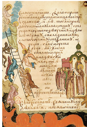
Η κλίμαξ του Παραδείσου, μικρογραφία χρ., ολαβονική μπφ. της Κλίμακος του Ιωάννου (περ. 1560), MS 1753, The Shoyen Collection

ροφορήσει για τους τρόπους της μοναχικής ασκήσεως. Ο Ιωάννης απέστειλε στον ηγούμενο Ραϊθού την Κλίμακα προτάσσοντας προσφωνητική επιστολή και επισυναπτοντας ένα παράρτημα αναφερόμενο στα καθήκοντα του ποιμένα με τον τίτλο Λόγος προς Ποιμένα . Ο τίτλος του έργου έχει ληφθεί από το όραμα του Ιακώβ (Γεν 28:12) και διαιρείται σε 30 Λόγους, αριθμός που υποδηλώνει την ηλικία της ωριμότητας του Ιησού, όταν άρχισε τη δημόσια δράση του: «Σπουδάσωμεν έως ου καταντήσωμεν εις την ένότητα πάντες τής πίστε-