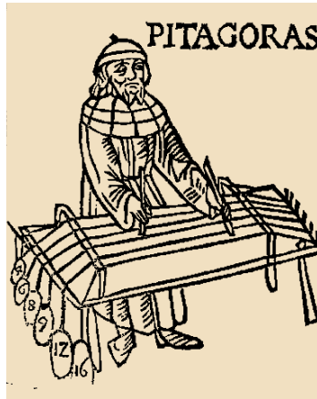
Ο Πυθαγόρας με το μονόχορδο, ξυλογραφία από το βιβλίο του Franchino Gaffurio, Theorica musicae (1492)

προς 1940. Ευθυμιάδης, Αβραάμ, Μαθήματα βυζαντινής εκκλησιαστικής μουσικής , Θεσσαλονίκη 1972. Κηλιτζανίδης, Π.Γ., Μεθοδική διδασκαλία θεωρητική τε και πρακτική προς εκμάθησιν και διάδοσιν του γνησίου εξωτερικού μέλους της καθ' ημάς ελληνικής μουσικής κατ' αντιπαράθεσιν προς την αραβοπερσικήν , Κωνσταντινούπολη 1881 (=Θεσσαλονίκη 1978). Düring, Ingemar, Κλαύδιου Πτολεμαίου Αρμονικών βιβλία τρία , Göteborg: Elanders 1934.