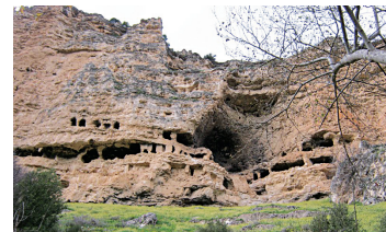
Ερημητήριο μοντανιστών στην Πέπουζα της Φρυγίας, ιερή πόλη του μοντανισμού

Ο μοντανισμός διέκρινε τους ανθρώπους σε πνευματικούς, ψυχικούς και σωματικούς, απαγόρευε τον γάμο, επέβαλλε πολλές νηστείες, απέκλειε την άφεση αμαρτιών μετά το Βάπτισμα και ενθάρρυνε τις ενθουσιαστικές τάσεις, με πολλές εθελούσιες προσελεύσεις στο μαρτύριο. Στον μοντανισμό προσχώρησε ο Τερτυλιανός. Ο Ευσέβιος