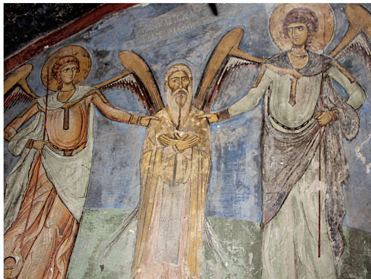
Ο ἅγιος Νεόφυτος, τοιχογραφία ἀπὸ την Ἐγκλείστρα (περ. 1193)

ἀπὸ την ἐγκλείστρα του, ἀπέκτησε ἀπὸ εὐσεβεῖς ἐπισκόπους της, το βιβλίο της Γενέσεως , την ἐρμηνεία εἰς τὴν Εξαήμερο του Βασιλείου και του Χρυσοστόμου και ἕνα κομμάτι Τίμιου Ἐύλου. Περί τα τέλη του 1166 ἢ τις ἀρχές του 1167 ἔλαβε χώρα και η πολυπόθητη τυπικὴ ἀναγνώριση της ἐγκλειστικῆς του πολιτείας, η λεγόμενη κάθειρξη, ἀπὸ την προϊσταμένη ἐκκλησιαστικὴ ἀρχή, τον Βασίλειο Κίνναμο, μετὰ την ἀνάρρηση του τελευταίου στον ἐπισκοπικὸ θρόνο της Πάφου (1166).