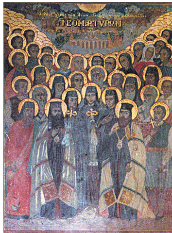
Ο θεϊός χορός των αγίων νεομαρτύρων, φορητή εικόνα (1942), έργο του αγίου γέροντα Σωφρονίου του Έσσεξ, ιερά μονή Αγίου Παύλου, Άγιον Όρος

της έντονης επιθυμίας να κηρύξουν τον Χριστό ως νικητή του θανάτου και του κακού, κάτι που αυτόματα θα συνεπέφερε την άμεση απόρριψη του ισλάμ. Ο άγιος Νικόδημος ο Αγιορείτης θεωρεί ότι οι νεομάρτυρες είναι «τῆς ἀσεβείας τῶν Ἀγαρνῶν ἡ κατάργησις», «γενναία