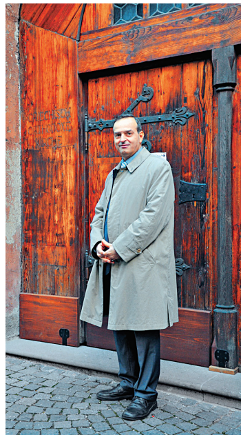
Ο καθηγητής Κωνσταντίνος Νικολακόπουλος

Νικολακόπουλος, Κωνσταντίνος. Έλληνας βιβλικός θεολόγος, Καθηγητής Τμήματος Ορθοδόξου Θεολογίας στο Πανεπιστήμιο του Μονάχου. Γεννήθηκε το 1961 στην Πάτρα, όπου ολοκλήρωσε την εγκύκλια εκπαίδευση. Σπούδασε Θεολογία στα Πανεπιστήμια Αθηνών (1979-1983), Regensburg και Μονάχου (1984-1989), όπου ειδικεύτηκε στην Καινή Διαθήκη και την Οικουμενική Θεολογία. Το 1991 αναγορεύθηκε διδάκτωρ Θεολογίας από τη Θεολογική Σχολή του Πανεπιστημίου Αθηνών. Από το 1991 έως το 1998 διετέλεσε επι-