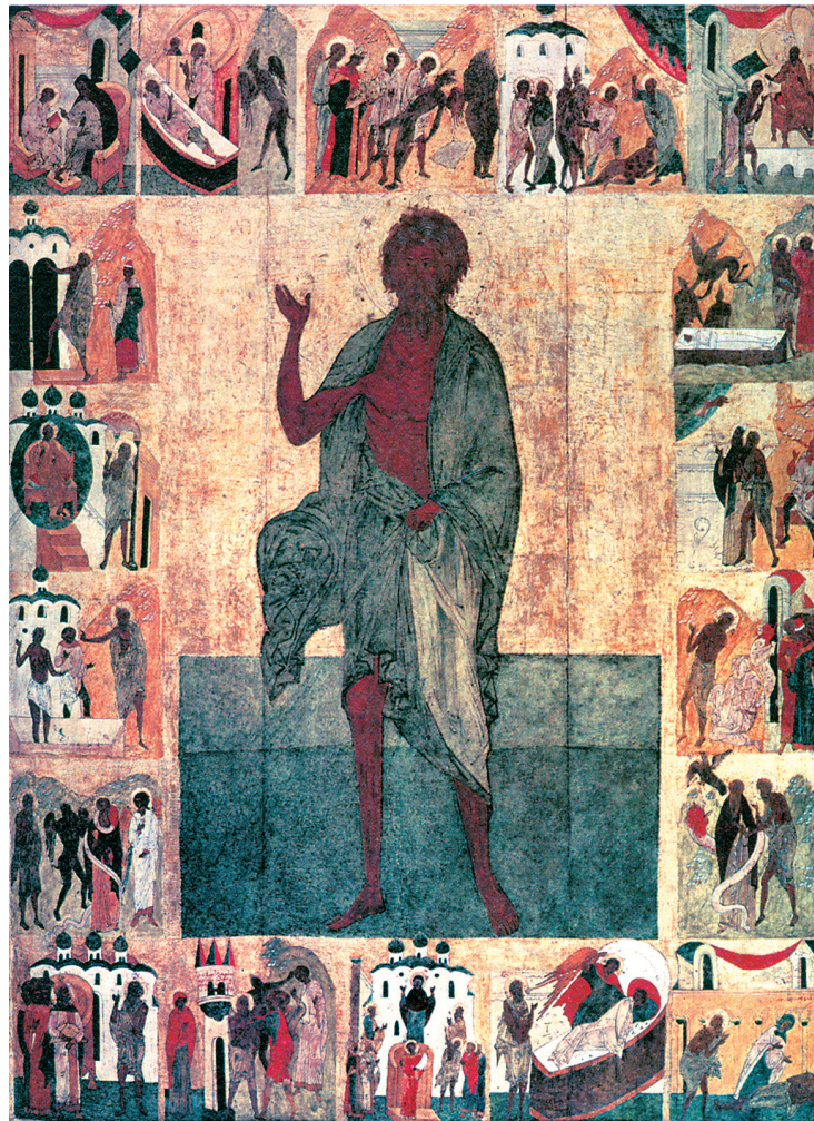
Όσιος Ανδρέας ο δια Χριστόν σαλός, φορητή εικόνα (αρχές 16ου αι.), Ρωσικό Μουσείο, Αγία Πετρούπολη

4. Ο δια Χριστόν σαλός (28 Μαΐου). Σκυθικής καταγωγής, έζησε επί της βασιλείας Λέοντος «του φιλοχρίστου και μεγάλου», κατά τον συγγραφέα του βίου του Νικηφόρο, ιερέα της Μεγάλης Εκκλησίας της του Θεού Σοφίας. Δεν είναι σαφές αν εννοείται ο Λέων Α΄ ο Μακέλης, ο επικληθείς Μεγάλος (457-474), ή ο Λέων Στ΄ ο Σοφός (886-912). Βρέθηκε, άγνωστο υπό ποιες συνθήκες, στην Κωνσταντινούπολη, και από μικρός ήταν δούλος του πρωτοσπαθάριου Θεογνώστου, ο οποίος του έδειξε αγάπη, τον έστειλε στο σχολείο να μάθει γράμματα και τον χρησιμοποιούσε ως νοτάριο. Μια νύχτα, ενώ προσευχόταν, ήρθε ο διάβολος να τον τρομάξει, αλλά του εμφανίστηκε άγγελος Κυρίου που τον ενίσχυσε και του έδειξε τον τρόπο να πολεμά τον διάβολο. Η γλυκύτητα της χάριτος που ένιωσε και η φωνή του Κυρίου που άκουσε («Γίνω σαλός δι' έμέ, ίνα σε άξιώσω πολλών αγαθών εις την βασιλείαν μου») τον οδήγησαν, σε ηλικία 36 ετών, να προσποείται στο εξής τον σαλό για την αγάπη του Χριστού, υψιστάμενος την περιφρόνηση, τη χλεύη και την κακομεταχείριση των ανθρώπων. Πολλές φορές, όταν προσευχόταν, υψωνόταν από τη γη. Μια νύχτα, ενώ προσευχόταν, ο Θεός τον μετέφερε «έως τρίτου ούρανού», όπως τον απόστολο Παύλο. Δεν κουραζόταν να ελέγχει τους αμαρτωλούς είτε με προειδοποιήσεις είτε με προκηρύξεις για την επικείμενη τιμωρία τους, προκειμένου να τους αφυπνίσει πνευματικά. Γνωρίστηκε και συνδέθηκε πνευματικά με έναν ευσεβή νέο, τον Επιφάνιο, για τον οποίο προφήτησε ότι θα γίνει πατριάρχης Κωνσταντινουπόλεως, και για