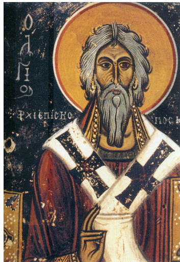
Άγιος Ανδρέας Κρήτης, τοιχογραφία (περ. 1300), αγία Παναγίας, Άγιος Ιωάννης, Κρήτη

Ορθοδοξία για έναν περίπου αιώνα. Ο άγιος Ανδρέας υπεράσπισε την ορθόδοξη άποψη. Μάλιστα υποστηρίχθηκε ότι ο θάνατός του σχετίζεται με την προσήλωσή του στον αγώνα υπέρ των ιερών εικόνων. Οι βιογράφοι του αναφέρουν ότι προέβλεψε το τέλος του. Καθώς επέστρεφε στην Κρήτη από την Κωνσταντινούπολη, απεβίωσε κατά τη διάρκεια του ταξιδιού του και ετάφη στον ναό της αγίας και καλλινίκου μάρτυρος Αναστασίας στην Ερεσό της Μυτιλήνης, στις 4 Ιουλίου του 740. Έχει υποστηριχθεί και η άποψη ότι η Μυτιλήνη δεν ήταν σταθμός του ταξιδιού του, αλλά τόπος