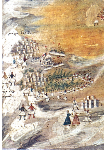
Παναγιώτης Ζωγράφος, Η μάχη στα Βέρβεννα (λεπτομέρεια)

στα Ορλωφικά το 1770. Ο δεύτερος, κατά κόσμον Θωμάς, γεννήθηκε στη Γορτυνία το 1787. Το 1813 διαδέχτηκε τον θείο του στην επισκοπή Βρεσθένης. Υπήρξε από τους πρώτους μυηθέντες στη Φιλική Εταιρία και αναδείχθηκε σε έναν από τους σπουδαιότερους ηγέτες της επανάστασης του 1821. Πολέμησε στις μάχες του