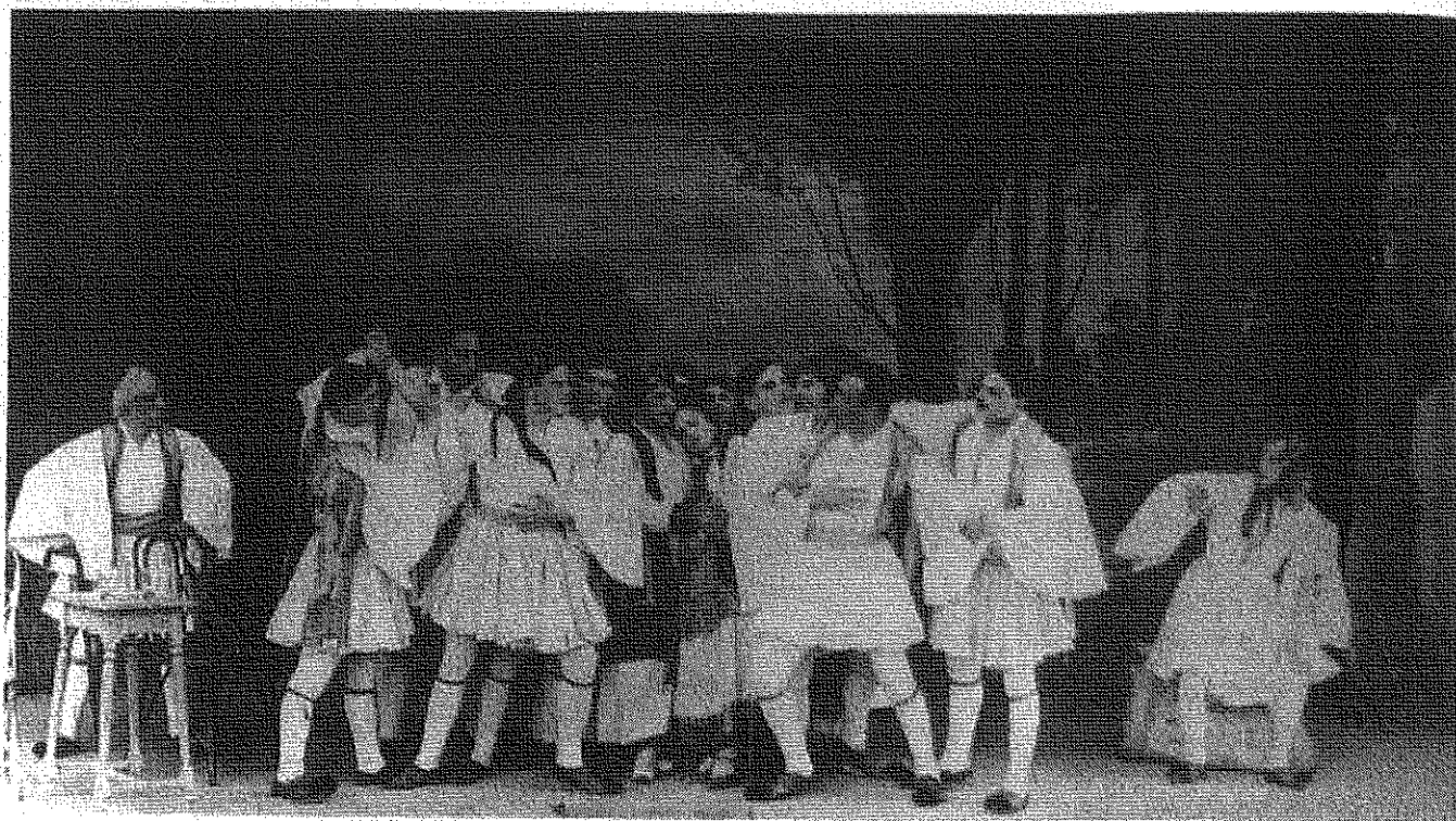
Από παράσταση στην Αλεξάνδρεια το 1928 «Ο αγαπητικός της Βοσκοπούλας»

δραμάτων του συρμού, εμπλουτιζόμενο κάθε φορά με την ελληνική δραματουργία (δράματα των Σπ. Ζαμπέλιου, Αλ. Ραγκαβή, Δημ. Βερναρδάκη, Σπ. Βασιλειάδη, κωμωδίες των Αγγ. Βλάχου, Νικ. Ζάνου, Χ. Άννινου και κωμειδύλλια των Δημ. Κορομηλά, Δ. Κόκκου κ.ά.) μαζί με ένα μεγάλο αριθμό μονόπρακτων κωμωδιών απαραίτητων για το κλείσιμο κάθε παράστασης, σύμφωνα με τη συνήθεια της εποχής. Η απαγόρευση από την τουρκική λογοκρισία έργων αναφερόμενων στην πρόσφατη ελληνική ιστορία στέρησε τις σκηνές του υπόδουλου ελληνισμού από τη σχετική ελληνική μετεπαναστατική θεατρική δραματουργία. Παράλληλα με τη συνεχή μεταφραστική προσπάθεια ξένου ρεπερτορίου, καθώς και με το ανέβασμα έργων αθηναίων δημιουργών, κάνει την εμφάνισή της και η πρωτότυπη κωνσταντινοπολίτικη θεατρική δημιουργία. Έτσι εμφανίζονται σημαντικοί θεατρικοί συγγραφείς, όπως οι Αλεξ. Ζωηρός, Οδ. Δημητράκος, Αλεξ. Σταματιάδης, Χρ. Σαμαρτζίδης, Αλεξ. Ραγκαβής, Δημ. Μισιτζής, Μιχ. Χουρμούζης, Κωνσταντίνος Ξανθόπουλος, Χριστ. Μισαηλίδης, Θωμάς Κωνσταντινίδης, Χρ. Χατζηχρήστος και άλλοι, λιγότερο γνωστοί, που με τα έργα τους δημιούργησαν την κωνσταντινοπολίτικη θεατρική λογοτεχνία.