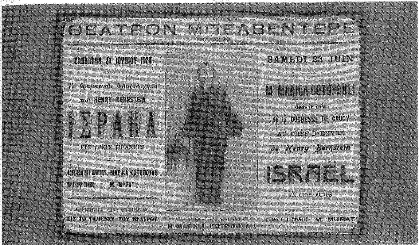
Πρόγραμμα της εποχής (1928) από παράσταση στην Κωνσταντινούπολη

Χουμαγιούν 1856), και θα στηριχθεί σε δύο παράγοντες: στους περιοδεύοντες θιάσους και στην ντόπια ερασιτεχνική δραστηριότητα των παντοειδών ελληνικών συσσωματώσεων (συλλόγων, λεσχών, ομίλων, σχολείων κ.ά.). Ως έκφραση πολιτιστικής δημιουργίας, το θέατρο θα καλύψει αφενός τις ανάγκες ψυχαγωγίας της διαμορφούμενης τάξης των ελλήνων αστών στα μεγάλα αυτά κέντρα του μείζονος ελληνισμού, αφετέρου θα χρησιμοποιηθεί ως μέσο καλλιέργειας της ελληνικότητας (ελληνική γλώσσα, ιστορία, παραδόσεις, ήθη και έθιμα) της ευρείας μάζας του ελληνικού στοιχείου, που κινδύνευε να αφελληνιστεί, εξαιτίας της συγχρώτσης του με αλλόθρησκες και αλλόγλωσσες εθνότητες. Η Κωνσταντινούπολη, συγκεντρώνοντας ένα συνεχώς αυξανόμενο ελληνικό πληθυσμό (287.000 Έλληνες το 1878), θα αποτελέσει το κέντρο της θεατρικής ζωής από το β' μισό του 19ου αι. έως το 1922. Με πρωτοπόρο τον Διον. Ταβουλάρη που έρχεται στην Κωνσταντινούπολη το 1858, θα ακολουθήσει η άφιξη μεγάλων θιάσων από την Αθήνα που παραμένουν για μεγάλα χρονικά διαστήματα και συντηρούν την εκεί ελληνική σκηνή (θίασοι Π. Σούτσα , Δ. Αλεξιάδη , Διον. Ταβουλάρη , Μιχ. Αρνιωτάκη , Νικ. Λεκατσά , Γεωρ. Πετρίδη και Αικ. Βερίωνη ) στα κεντρικά θέατρα (Ναούμ «Κρυστάλλινον