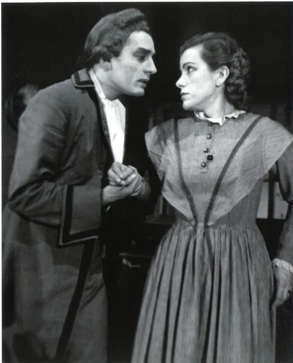
Σκηνή από το έργο Έρωσ και ραδιουργία που παρουσίασε το Πειραιϊκό Θέατρο στο Δημοτικό 1958.