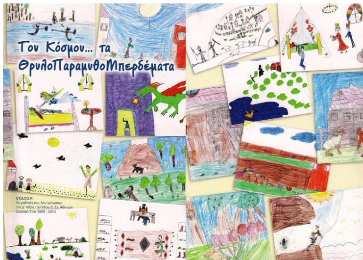
Του Κόσμου... τα ΘρυλοΠαραμυθοΜπερδέματα (2010)