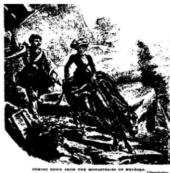
COMING DOWN FROM THE MONASTERIES OF METEORA. (Pencil sketch)