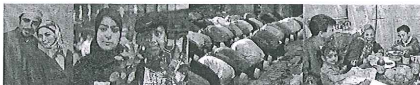
Εικόνες που υπάρχουν στο ερωτηματολόγιο.