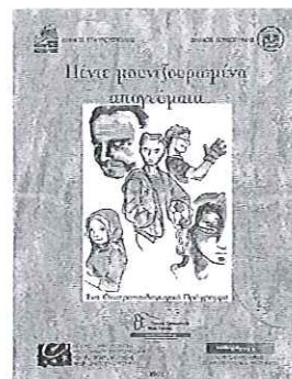
Η έκδοση (2007) που περιλαμβάνει το Φάκελο Υλικού.

τροπαιδαγωγικού προγράμματος. Η τρίτη ενότητα περιλαμβάνει Κείμενα, τα οποία μπορούν να αξιοποιηθούν είτε σε συνδυασμό με την εφαρμογή του θεατροπαιδαγωγικού προγράμματος είτε στη διδασκαλία σχετικών ενοτήτων-μαθημάτων είτε ανεξάρτητα.