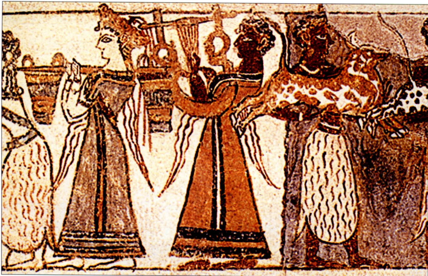
1. Γραπτός λυριστής σε τοιχογραφημένη σαρκοφόγο από την Αγία Τριάδα (MIN 4). Ηράκλειο, Αρχαιολογικό Μουσείο, αρ. 396.