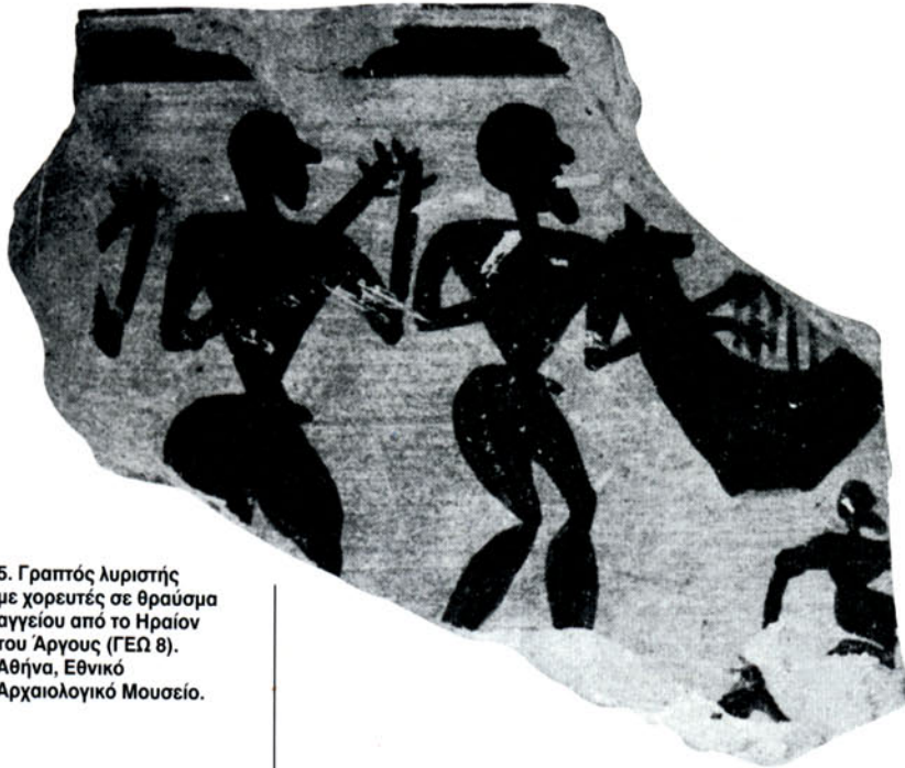
5. Γραπτός λυριστής με χορευτές σε θραύσμα αγγείου από το Ηραίον του Άργους (ΓΕΩ 8). Αθήνα, Εθνικό Αρχαιολογικό Μουσείο.

1050 π.Χ.). Τα όργανα της μυκηναϊκής εικονογραφίας είναι: α) η πεταλοειδής λύρα (MYK 1), ανάλογη της (πιθανής) μινωικής πεταλοειδούς (MIN 1) και β) η οκτάσχημη λύρα (MYK 2), του τύπου της μινωικής σαρκοφάγου (MIN 4). Η λέξη ru-ra-ta-e (= λυρισται ), που απαντάται σε πινακίδα της Γραμμικής Β (MYK 3), πιστοποιεί την ύπαρξη της λέξης «λύρα» για το όργανο, δεν μπορούμε όμως να αποφανθούμε αν ο όρος αναφέρεται και στους δύο τύπους του μυκηναϊκού οργάνου, αυτόν με τους ευθείς πήχεις (πεταλοειδή) και αυτόν με τους οφιοειδείς (οκτάσχημο) 13 .