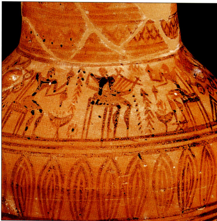
6. Γραπτός λυριστής σε αττική οινόχρη (ΓΕΩ 11).

Εκ πρώτης όψεως η λύρα στο κρητικό αγαλ- ματίδιο (ΓΕΩ 1) φαίνεται να ανταποκρίνεται στην πραγματικότητα περισσότερο από όλες τις άλ- λες απεικονίσεις του οργάνου: ψηλό ηχείο (πρβλ. ΓΕΩ 22, 23 – ΑΝ 8-11) για καλή ακουστό- τητα και ο χορδοτόνος στην αναμενόμενη θέση, στην βάση του αντηχείου και μπροστά από το ηχείο. Αυτήν, τουλάχιστον, την μορφή έχουν όλες οι μεταγενέστερες ελληνικές παραστάσεις της πεταλοειδούς λύρας (βλ. Maas / McIntosh Snyder 1989: 139-45), αλλά και άλλες, τόσο ανα- τολικές (ΑΝ 1) όσο και ετρουσκικές (ΕΤ 2, 3, 4, 5, 6), παρ' όλες τις διαφορές τους σε άλλα σημεία. Ο σχετικά μεγάλος, καμπύλος χορδοτόνος έχει το ανάλογο του στην μινωική πυξίδα (ΜΙΝ 6), όπου, όμως, είναι ζωγραφισμένος ψηλότερα από το αντηχείο, προφανώς για να δηλωθεί η ύπαρξη του μέλους αυτού του οργάνου, που αλ- λιώως θα παρέμενε αθέατο (πρβλ. μυκηναϊκό