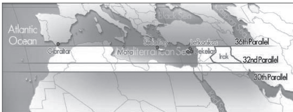
Χάρτης 2. Ἡ Ζώνη ἀγγλοσαξωνικῶν γεωστρατηγικῶν στοχεύσεων καὶ ἐπιρροῶν: 30δς-36ος παράλληλος

«Μη Έκγερμανίσμοι» ( Eindeutschungs-Unfähig ) 16 — πρὸς ὄφελος τοῦ «χιλιετοῦς Ράιχ», τοῦ «Μεϊζονος Εὐρωπαϊκοῦ Χώρου» ( Europäischer Grossraum ), τοῦ «Μεϊζονος Εὐρωπαϊκοῦ Οἰκονομικοῦ Χώρου» ( Europäische Grossraum-Wirtschaft ) καὶ τῆς «Νέας Εὐρωπαϊκῆς Τάξεως» ( Europäische Neu-Ordnung ). Στὸ πλαίσιο αὐτὸ ἡ Γαλλία καὶ ἡ Ἰταλία, ὅπως καὶ οἱ σκανδιναβικὲς χῶρες, ἔχουν συμπληρωματικὸ γεωπολιτικὸ ρόλο στὸν γεωπολιτικὸ σχεδιασμὸ τῶν θαλασσιῶν καὶ τῶν χερσαίων δυνάμεων ἀντιστοίχως. Σημαντικώτατο μέρος αὐτοῦ τοῦ γεωπολιτικοῦ ρόλου στὸν σχεδιασμὸ τῶν θαλασσιῶν δυνάμεων, δηλαδὴ τῶν ἀγγλοσαξωνικῶν, ἔχει μέχρι σήμερα καὶ ἡ Ἑλλάς, ὡς σημεῖο κλειδὶ τῆς Μεσογείου, τῶν Δαρδανελλίων, τοῦ διαύλου τοῦ ἀνατολικοῦ Αἰγαίου (μὲ τὰ τόσα σημερινά, πιά, προβλήματα), καὶ τῆς νότιας ζώνης τῆς Μεσογείου μεταξὺ 35ου καὶ 36ου παραλλήλου. (Βλ. Χάρτη 2). Μιὰ πολὺ ἐνδιαφέρουσα, ἀπὸ γεωπολιτικῆς ἐπόψεως, ζώνη, ἐμπεριέχουσα τὸ Ἰσραήλ, τὴν Κύπρο, τὴν Κρήτη, τὴν Μάλτα καὶ τὸ Γιβραλτάρ, 17 ἡ ὁποία μέχρι σήμερα χαρακτηρίζεται ἀπὸ ἔντονη ἀστάθεια, ἰδιαίτερος μετὰ ἀπὸ τὰ ἐξεγερσιακὰ φαινόμενα τῆς οὕτω καλουμένης, κατ' ἀγγλοσαξωνικὴν ἔμπνευσιν, «Ἀραβικῆς Ἀνοιξέως» ( Arab Spring ) 18 ἀλλὰ καὶ σημαντικωτάτη ἀγγλοσαξωνικὴ στρατιωτικὴ καὶ πολιτικὴ παρουσία.