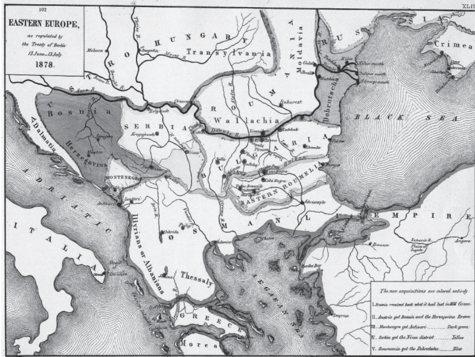
Χάρτης 2: Τὰ ἀποτελέσματα τοῦ Συνεδρίου τοῦ Βερολίνου. By Robert H. Labberton, E. Elaxton and Co. - Map from "An Historical Atlas" by Robert H. Labberton, E. Elaxton and Co., 1884., Κοινὸ Κτῆμα, https://commons.wikimedia.org/w/index.php?curid=944831

ξε τὰ Ἀρμενικὰ καὶ Ἀφγανικὰ ἐδάφη, ὅπως καὶ στὴν Ν/Α Μεσόγειο νὰ διακυβεύονται, ἐνοχλεῖται σφόδρα καὶ τελικῶς, μὲ τὸ Ἀγγλο-Ρωσικὸ σύμφωνον τῆς 1/6/1878 ἀποσπᾶ ἀπὸ τὸν Τσάρο τὴν ὑπόσχεση ὅτι θὰ σταματήσει τὴν προέλαση τῶν στρατευμάτων του στὸ ρωσο-τουρκικὸ μέτωπο καὶ ὅτι δὲν θὰ προχωρήσει περισσότερο στὸ ἐσωτερικὸ τῆς Μ. Ἀσίας. Ἐπίσης ἐκμεταλλευομένη τὸ καλὸ κλίμα τῶν σχέσεών της μὲ τὸν Σουλτάνο λόγω τῶν ὑπηρεσιῶν ποὺ μέχρι τότε τοῦ εἶχε ἀδιαλείπτως προσφέρει βάσει τοῦ δόγματος Ντισραέλη, κατορθώνει νὰ τῆς παραχωρηθεῖ ἡ Κύπρος, ὥστε νὰ δύναται νὰ ἐλέγχει τὴν ἔξοδο τῆς Ρωσσίας στὴν θερμὴ θάλασσα ἀπὸ τὴν Ἀλεξανδρέττα ἀλλὰ καὶ τὸ Σουέζ.