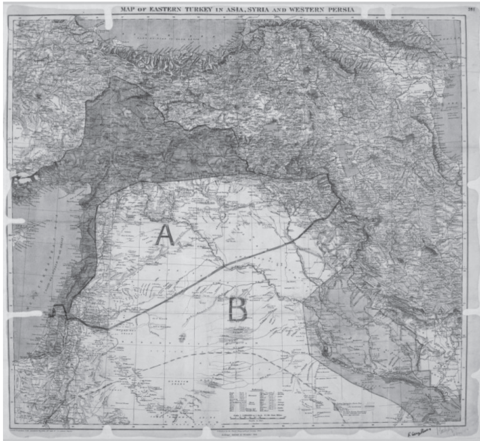
Χάρτης 4. Χάρτης τοῦ Sykes-Picot Agreement, πὸν καταδεικνύει τὴν περιοχὴ τῆς Ἀνατολικῆς Τουρκίας στὴν Ἀσία, τὴν Συρία καὶ τὴν Δυτικὴ Περσία, ὅπως καὶ τὶς περιοχὲς ἐλέγχου καὶ ἐπιρροῆς πὸν συμφωνήθησαν μεταξὺ Βρεταννίας καὶ Γαλλίας. Royal Geographical Society 1910-15. Ὑπογεγραμμένοι ἀπὸ τοὺς Mark Sykes καὶ Francois-Georges Picot, 8 Μαΐου τοῦ 1916.

τῶν πόλεων Χάμα, Χόμς, Χαλεπίου καὶ Δαμασκού, δηλ. τοῦ Λιβάνου καὶ τῆς Κιλικίας, ἡ ὁποία ἦταν πλήρης ἄρμενικῶν πληθυσμῶν καὶ ἡ ὁποία προφανῶς προωρῶντο γιὰ τὴν Γαλλία πρὸς τὴν διεξεδίκε ἀπὸ τοῦ Μαρτίου τοῦ 1915. Οἱ Γάλλοι, ὑπὸ τὸ καθεστῶς τῆς βρεταννικῆς ὑπεροχῆς καὶ ἔχοντες οὐσιαστικῶς ἐξασφαλίσαι τὴν Κιλικία καὶ τὸν Λίβανο δὲν ἄργησαν νὰ συγκατανεύσουν στὴν ὑπογραφή τοῦ Συμφώνου Sykes-Picot τὸν Μάρτιο τοῦ 1916 τὸ ὁποῖον ἐπεκύρωσε καὶ ἡ Ρωσσία μὲ ἀντάλλαγμα τὶς βορειοανατολικῆς ἄρμενικῆς ἐπαρχίης τῆς Τουρκίας, τὴν δυτικὴ ὄχθη τοῦ Βοσπόρου, τὴν Θάλασσα τοῦ Μαρμαρᾶ καὶ τὰ Δαρδανέλλια. Ἡ Βρεταννία βέβαια δὲν ἐκράτησε τὶς ὑποσχέσεις τῆς στὸν Σερίφ τῆς Μέκας, ἀλλὰ ἡ Συμφωνία Sykes-Picot ἐκρατήθη μυστικῆ μέχρι τῆς ἀνόδου τῶν Σοβιετικῶν στὴν ἐξουσία, ὅποτε καὶ ἐδημοσιεύθη τὸν Δεκέμβριο τοῦ 1917.