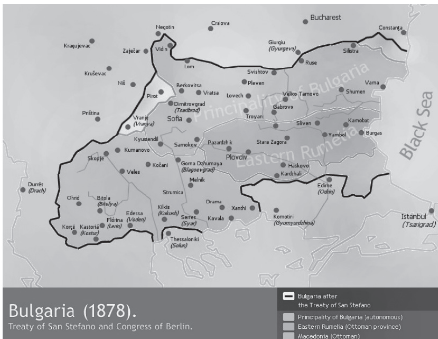
Χάρτης 1: Τὰ σύνορα τῆς Μεγάλης Βουλγαρίας, 1878

Φυσικὰ, δὲν συζητῶ γιὰ τὰ καταστροφικὰ γιὰ τὸν Ἑλληνισμὸ ἀποτελέσματα τῆς Συνθήκης αὐτῆς.