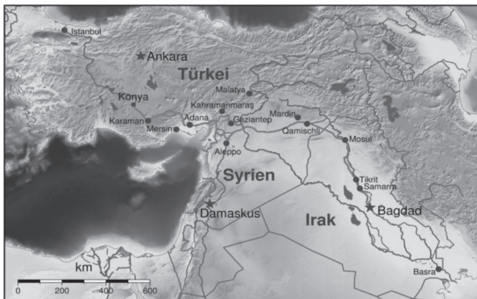
Χάρτης 3: Ὁ Σιδηρόδρομος Bagdadbahn.

Φαίνεται πλέον καθαρά ότι η Γερμανία έχει αναγορευθεί προστάτις της Οθωμανικής Αυτοκρατορίας, γεγονός που απέδειξε περιτρώως το ταξίδι του Γουλιέλμου Β΄ στην Κωνσταντινούπολη και την Ιερουσαλήμ και η ανακήρυξίς του σε «Ἡρώα τοῦ... Ἰσλάμ!» (Ἰκτώβριος τοῦ 1889). Προφανῶς δὲν πρόκειται γιὰ... ἀλλαγὴ θρησκείας τοῦ Γερμανοῦ ἐστεμμένου, ἀπλῶς ἐμφανίζει τὴν ἐπίσημη ἔναρξη τῆς γερμανικῆς ἐπεμβάσεως στὸν οἰκονομικὸ πυλῶνα ἰσχύος τῆς Οἰκουμενικῆς Αυτοκρατορίας καὶ στὸν «δευτερογενῆ-αἰτιατικὸ» οἰκονομικὸν τῆς Χῶρο. Ἡ κατάστασις εἰς ὅ,τι ἀφορᾷ τὴν βλέψει τῆς Γερμανίας στὴν Μ. Ἀσία διευκρινίζεται ἀπολύτως ὅταν ἀνακοινῶνται τὸ συμφωνοῦν τοῦ σιδηροδρόμου Βοσπόρου-Βαγδάτης μὲ κεφάλαια ἰσχυρῶν οἰκονομικῶν ὁμίλων ποὺ ὑπεστηρίζοντο ἀπὸ τὴν Deutsche Bank, καὶ τοῦ ὁποῖου τὸ ἄνω ἄκρον θὰ κατέλιγε στὸ Βερολῖνον.