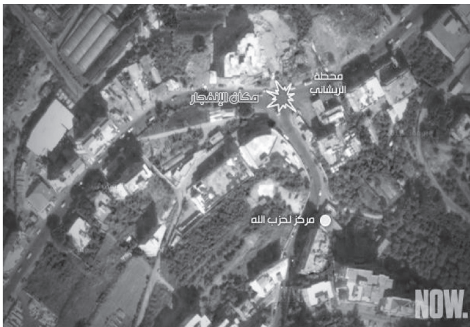
Χάρτης 5: Σονιτική βομβιστική επίθεση στο Σουείφατ, Νοτία Βηρυτός