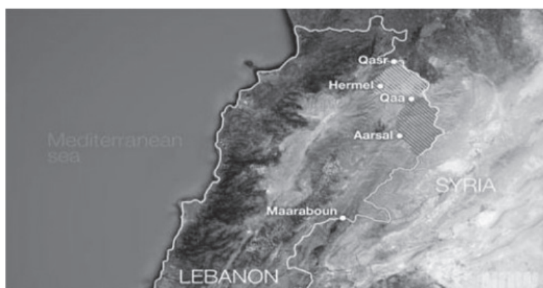
Χάρτης 4: σονιτικὲς βομβιστικὲς ἐπιθέσεις στὴν ἀνατολικὴ πόλη Χερμέλ

Στις 19 Νοεμβρίου 2013, μιὰ διπλή βομβιστική επίθεση με στόχο την ιρανική προεσβεία στην Βηρυτόν είχε ως αποτέλεσμα τὸν θάνατο 23 ἀνθρώπων καὶ τὸν τραυματισμὸ δεκάδων. Τὴν εὐθύνη ἀνέλαβε ἡ λιβανική σονιτική ὀργάνωση «Ταξιαρχία Άμπντουλά Άζάμ», διατηροῦσα σχέσεις με τὴν Ἄλ-Κάϋντα. Στὴν συνέχεια ἠκολούθησε σειρά βομβιστικῶν ἐπιθέσεων με «παγιδευμένα» ὀχήματα καὶ ἐπιθέσεις αὐτοκτονίας σὲ διάφορες περιοχὲς τῆς νοτίου Βηρυτοῦ καὶ τοῦ ἀνατολικοῦ Λιβάνου ἐλεγχόμενες ἀπὸ τὴν Χεζμπολά: 17 Δεκεμβρίου 2013 στὴν ἀνατολικὴ πόλη Χερμέλ, (Χάρτης 4), στὶς 2 Ἰανουαρίου 2014 στὸ νότιο προάστειο τῆς Βηρυτοῦ, τὴν 1ην Φεβρουαρίου 2014 στὴν ἀνατολικὴ πόλη Χερμέλ (Χάρτης 4) τὴν 3ην Φεβρουαρίου 2014 στὸ Σουείφατ στὴν νότια Βηρυτόν (Χάρτης 5), τῆς ὁποίας τὴν εὐθύνην ἀνέλαβε τὸ Μέτωπο ἀλ-Νόσρα..