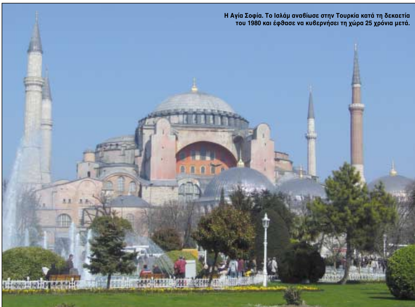
Η Αγία Σοφία. Το Ισλάμ αναβίωσε στην Τουρκία κατά τη δεκαετία του 1980 και έφθασε να κυβερνήσει τη χώρα 25 χρόνια μετά.

Εδώ λοιπόν καταρρέει, για μια ακόμη φορά, το όραμα του Χ. Γιανναρά, από τους ίδιους τους μελλοντικούς συν-υλοποιητές του. Κι αυτό γίνεται ακόμη πιο εμφανές από το γεγονός του ισχυρού τουρκικού-εθνικιστικού και ισλαμιστικού χα-