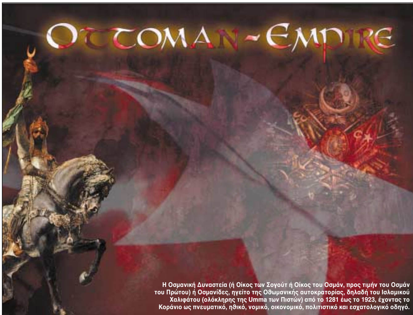
Η Οσμανική Δυναστεία (ή Οίκος των Σογούτ ή Οίκος του Οσμάν, προς τιμήν του Οσμάν του Πρώτου) ή Οσμανίδες, ηγείτο της Οθωμανικής αυτοκρατορίας, δηλαδή του Ισλαμικού Χαλιφάτου (ολόκληρης της Υπμα των Πιστών) από το 1281 έως το 1923, έχοντας το Κοράνιο ως πνευματικό, ηθικό, νομικό, οικονομικό, πολιτιστικό και εσχατολογικό οδηγό.

ψουμε, επαναλαμβάνω, τον εξανδραποδισμό μας στον «άμοιρο πολιτισμό», όπως ο ίδιος ισχυρίζεται, νεο-οθωμανό ανατολίτη Δεσπότη για «να σώσουμε τον Ελληνισμό»! Μα κανένας πολιτισμός δεν σώζεται εντός του προαναφερθέντος «α-πολιτισμικού» περιβάλλοντος και επίσης κανένας πολιτισμός δεν σώζεται με επαιτεία! Μόνο με την ανθρώπινη πνευματική και πρακτική δράση, μάλιστα σε ελευθερία, αν πρόκειται για τον ελληνικό πολιτισμό! Ας θυμηθούμε τον θείο Διονύσιο Σολωμό! Και, κυρίως, ας μην αναμινύουμε τις όποιες τυχάρπαστες ελλαδικές «ελίτ» με τον Ελληνισμό! Δεν είναι απλώς λάθος, είναι έγκλημα! Μού έρχεται δύσκολο να τα λέω αυτά στον Χ. Γιανναρά, αλλά με υπερβαίνει η αριστοτελική λογική μου! Εύχομαι, ειλικρινά, να μην κατάλαβα τα γραφόμενά του! Το προτιμώ!