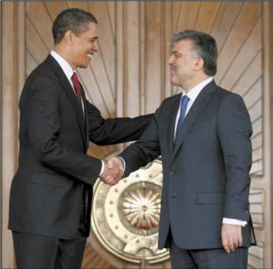
Οι πρόεδροι Ομπάμα και Γκιούλ ανταλλάσσουν χειραψία. Η αναβάθμιση της γεωπολιτικής θέσης της Αγκυρας από τις ΗΠΑ αποτέλεσε μια αναμενόμενη εξέλιξη.

μπορούμε να συζητήσουμε και τι νόημα θα είχε; Θα το πράξουμε όμως αμέσως, από επιστημονικό καθήκον.