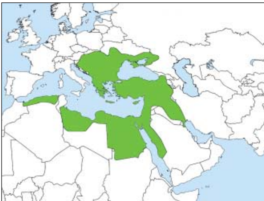
Η Οθωμανική αυτοκρατορία το 1566. Στις ημέρες μας στην Τουρκία γίνεται μια επαναξιολόγηση του οθωμανισμού. Δεν πρόκειται απλώς και μόνο για μια ιδεολογία αλλά για διαφορετικές γεωπολιτικές συνθήκες. Το αποτέλεσμα είναι ένας παν-τουρκικός νεο-οθωμανισμός.

ξίας ισλαμικού πολιτισμού». Αρα καταρρίπτεται επίσης και ολόκληρο το λογικό οικοδόμημα που έκτισε ο συνάδελφος επάνω του! Παραδόξως, φαίνεται ότι ο Χ. Γιανναράς επιλέγει να θυσιάσει -τουλάχιστον στα γραφόμενά του- αυτό που μέσα του θεωρεί τόσο κατάλληλο ως αιγίδα, θα λέγαμε, για τον δήθεν «παρακμάζοντα» Ελληνισμό, τ.έ. το Ισλάμ, υποστηρίζοντας ότι δεν διαθέτει πολιτισμό, προκειμένου να το καταστήσει «ακίνδυνο» στα μάτια των αναγνωστών του. Είναι σαν να μας λέει: «Μη διστάζετε να δεχθείτε την επικυριαρχία του Ισλάμ, αφού δεν θα αλλοιώσει τίποτα από τα εθνικά σας χαρακτηριστικά, τα οποία ούτως ή άλλως έχετε απολέσει. Με το Ισλάμ και συνεπώς με την απεμπόλιση κάθε δυτικού στοιχείου απλώς θα τα ξαναβρείτε»!