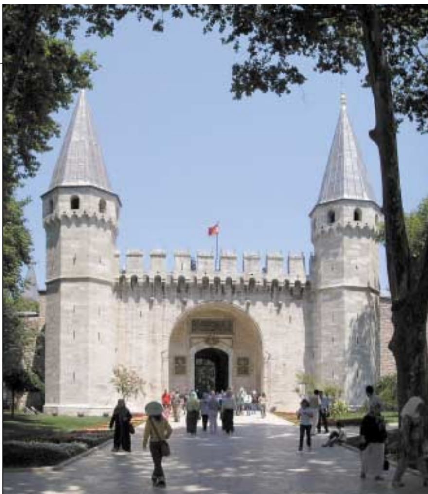
Τα ανάκτορα του Τοπ Καπί. Ο Τουργκούτ Οζάλ, μίλησε περί ευκαιριών οι οποίες παρουσιάζονται κάθε τριακόσια χρόνια και εξήγησε ότι «η παρούσα ιστορική συγκυρία δίνει τη δυνατότητα στην Τουρκία, διά της ενεργοποίησης των μουσουλμανικών μειονοτήτων στην Αλβανία, στη Γιουγκοσλαβία, στη Βουλγαρία και στην Ελλάδα να αναστρέψει την πορεία συρρίκνωσης της, η οποία ξεκίνησε προ των τειχών της Βιέννης».

Αναφορικά δε με τον καλπασμό του Ισλάμ στην Τουρκία, ο καθηγητής Amikam Nachmani αναφέρει (με στοιχεία 2003) ότι περίπου 1.500 νέα τεμένη κτίζονται κατ' έτος και μέχρι το 2003 στην Τουρκία υπήρχαν ήδη 80.000 μουσουλμανικά τεμένη, πράγμα που μας δίδει την αναλογία ενός τεμένου ανά 800 Τούρκους πολίτες! Συμπληρώνει μάλιστα ότι τα μεγέθη αυτά αναδεικνύουν τη θρησκευτική ισχύ του τουρκικού Ισλάμ απέναντι στην ανίσχυρη πολιτικά κεμαλιστική τάση (1).