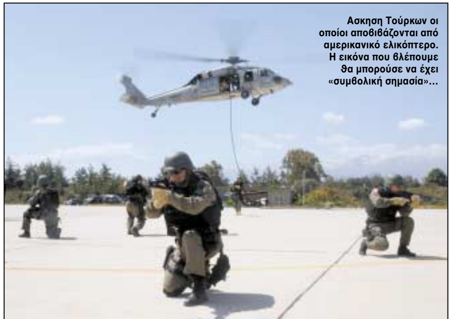
Ασκηση Τούρκων οι οποίοι αποθιβάζονται από αμερικανικό ελικόπτερο. Η εικόνα που βλέπουμε θα μπορούσε να έχει «συμβολική σημασία»...

Αναρωτιέμαι ακόμα πώς τη γλίτωσε ο Ελληνισμός τετρακόσια ολόκληρα χρόνια από τούτη την «οντολογική συναίσθηση»! Και προσπάθησαν επαρκώς να μας την «κοινωνήσουν», επίσης, αυτή την «ισλαμιστική καθολικότητα», μάλιστα με τους πλέον συστηματικούς εκτουρκισμούς, οι οθωμανοί κυρίαρχοι! Νομίζω...! Δεν ορρωδήσαν μάλιστα ούτε στη χρήση της «λαϊκής κουλτούρας της Ανατολής», δηλαδή των ετερόδοξων δερβισικών Ταγμάτων, όπως οι Μπεκτασιήδες, για να επιτύχουν τους εκτουρκισμούς τους αυτούς. Επ' αυτού όμως θα επανέλθω παρακάτω, για να διαλύσω τον μύθο περί «λαϊκού πολιτισμού της Ανατολής» στον οποίο βασίζεται ένα μέρος της συλλογιστικής του Χ. Γιαν-