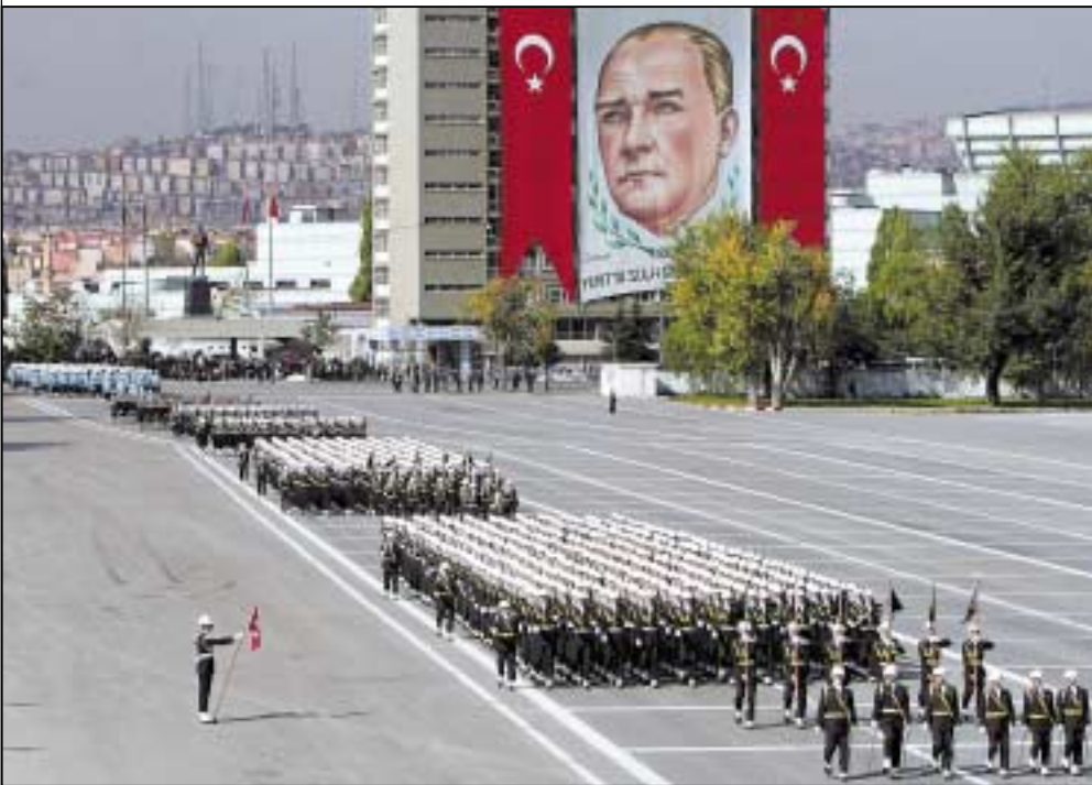
Παρέλαση των Τουρκικών Ενόπλων Δυνάμεων. «Η Τουρκία είναι υποψήφια χώρα να γίνει μια παγκόσμια υπερδύναμη, θασισμένη στην παρελθούσα και στην παρούσα Θέση της».

στην αραβική γλώσσα τις προηγούμενες Γραφές για να προειδοποιήσει εκείνους που αδικούν και να δώσει χαρά σε όσους κάνουν το καλό» (Σούρα 46, Χα-Μα, "Al-Ahkaff: Οι Αμμόλοφοι", Μέκκα, Σουράτ 12) - 14.